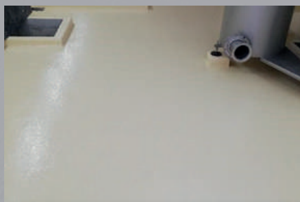
Attaques chimiques (exposition continue)