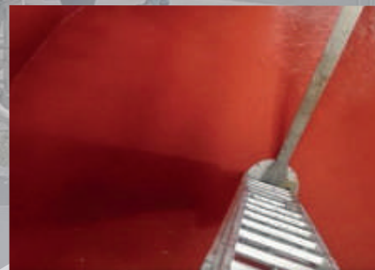
Système d'étanchéité liquide (SEL)