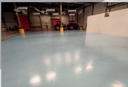
Méthacrylate (séchage rapide)