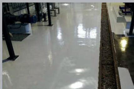
Antistatique / ESD