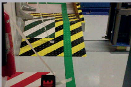
Marquage au sol