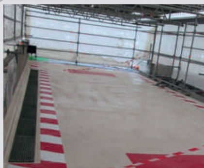
Aire de dépôtage