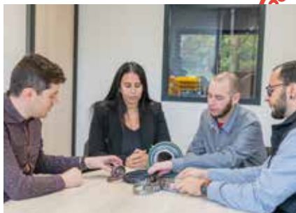
Service Business Solutions

Que vous soyez un fabricant, industriel, PME-PMI, sous-traitant, agriculteur ou artisan, 123Roulement Business Solutions vous propose des solutions adaptées.