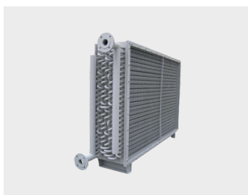
Batterie de récupération