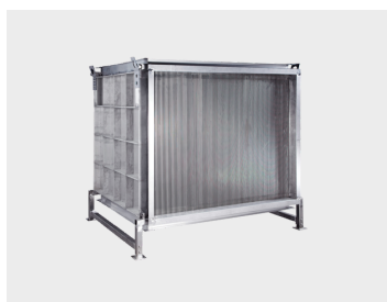
Récupérateurs de chaleur très haute température