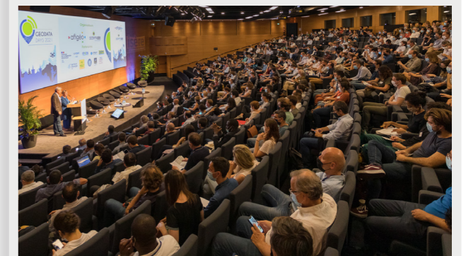
GEODATADAYS 2021

Ne manquez pas le rendez-vous de l'innovation géomatique ! www.geodatadays.fr