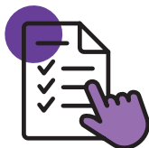
Cadrage du projet

Quelque soit la maturité de votre projet, nos conseillers vous accompagnent à chaque étape du processus de reprise :