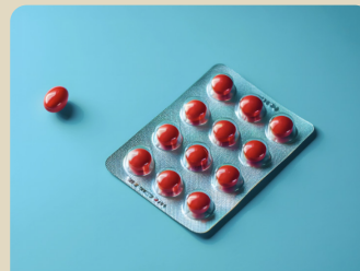
MÉDICAMENTS ET TRAITEMENTS SUR ORDONNANCE