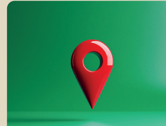
ALLOCATION DE SOLIDARITÉ AUX PERSONNES AGÉES (ASPA)