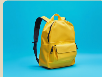
ALLOCATION DE RENTRÉE SCOLAIRE