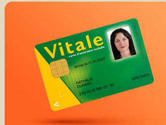
LA CARTE VITALE