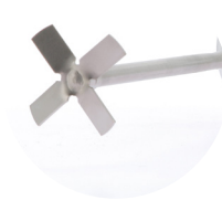
Turbo agitateur PC018