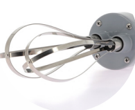
Double fouet PC021