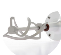
Tige hélicoïdale 185 mm : PC0182