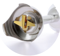
Cisailleur 4 lames 160 mm : PC022 190 mm : PC023