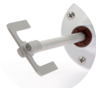
Tige pale en U 185 mm : PC0183