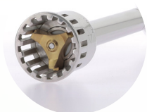
Rotor-stator 160 mm : PC010 190 mm : PC011