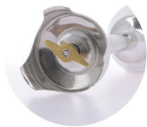
Cisailleur 2 lames 160 mm : PC012 190 mm : PC013