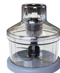
Bol cutter PC020