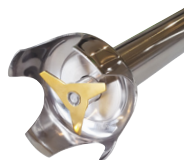
Cisailleur 3 lames