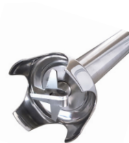
Cisailleur 4 lames