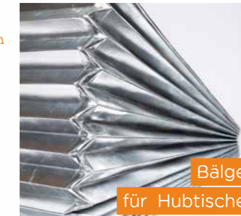
Bälge für Hubtische