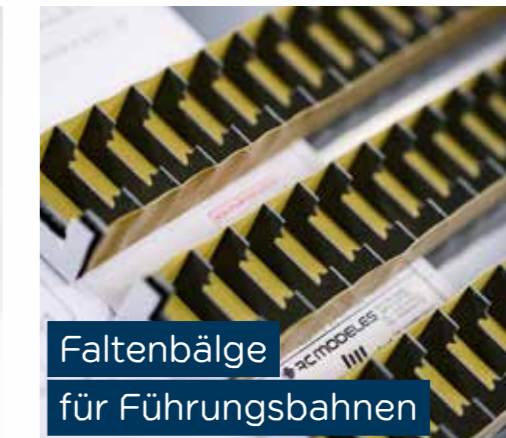
Faltenbälge für Führungsbahnen