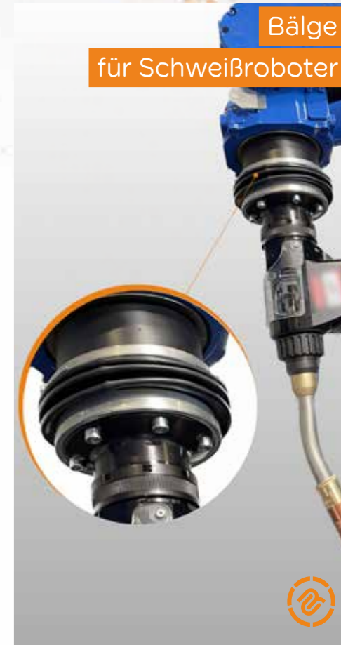
Bälge für Schweißroboter