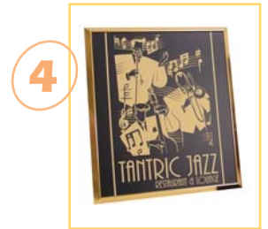
4 Produit fini

* Thermoflan vous propose une gamme complète de lasers CO2 pour la gravure et la découpe