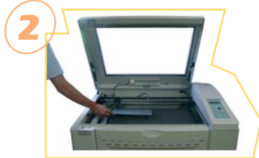
2 Mise en place de la matière dans la graveuse laser*