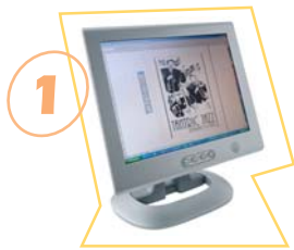
1 Composition de votre graphisme