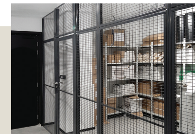
Espace délimité par une cloison industrielle grillagée ACTIWALL pour sécuriser le stock