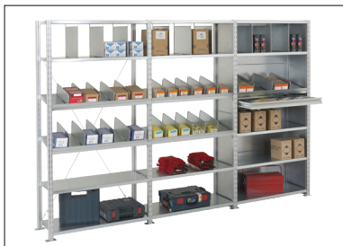
Rayonnage ACTIVANCE pour tout type de stockage, compatible avec une large gamme d'accessoires