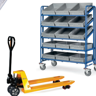
Gamme étendue de transpalettes et gerbeurs manuels ou électriques, de chariots, dessertes, diables, servantes, rolls, tables élévatrices et nacelles