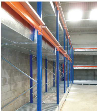
Rayonnages ACTIRACK avec bacs de rétention incorporés pour l'entreposage de fûts ou de charges spécifiques suivant les recommandations ou normes en vigueur