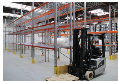
Installation de rayonnages à palettes ACTIRACK pour des charges lourdes à manutentionner au chariot élévateur