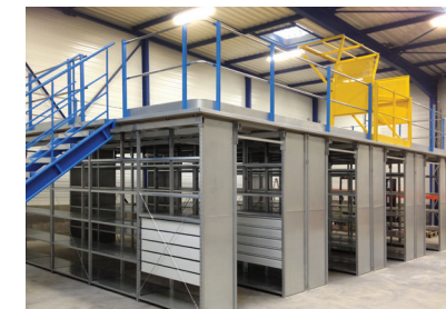
Conception d'une plate-forme de stockage sur une structure de rayonnage tôlé ACTIVANCE , pour optimiser l'espace de l'entrepôt