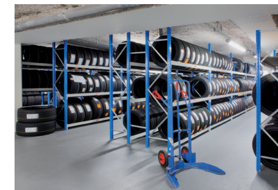
Espace de stockage aménagé avec des rayonnages ACTIVOL à longerons porte-pneus et diable adapté pour le transport et la manipulation de pneumatiques