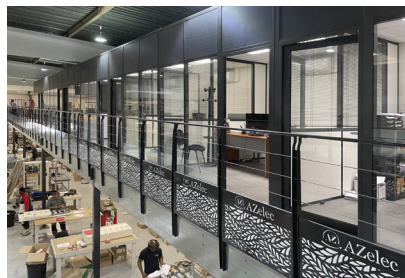
Aménagement de bureaux en mezzanine sur une plate-forme ACTIFLOOR , au-dessus d'un atelier de production