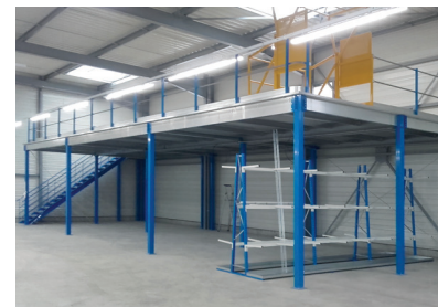
Exploitation du volume d'un entrepôt, en augmentant la surface de stockage au sol grâce à une plate-forme ACTIFLOOR