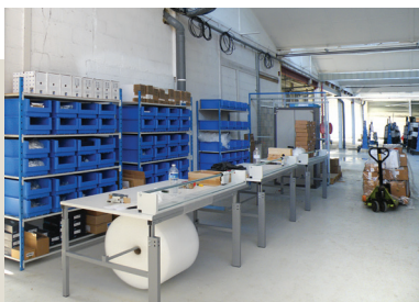
Postes de travail étudiés et adaptés, avec établis ergonomiques