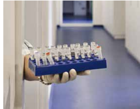
Laboratoires d'analyses médicales