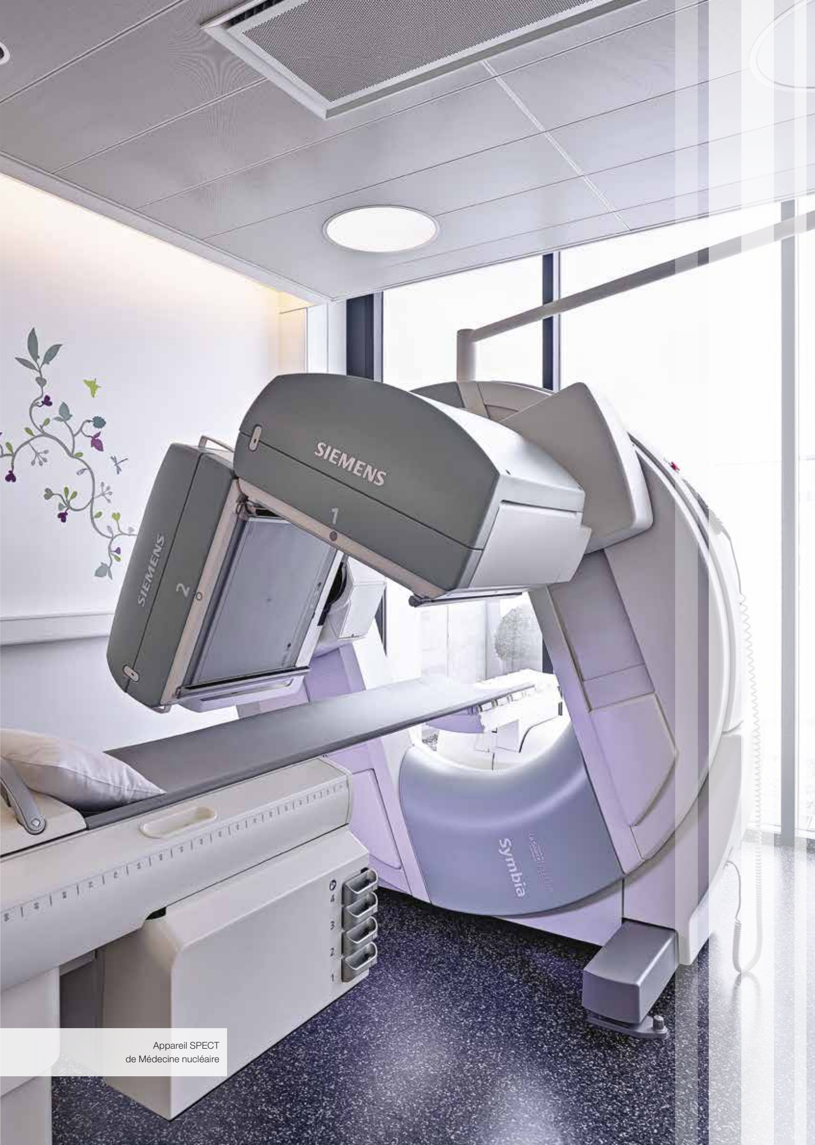
Appareil SPECT de Médecine nucléaire