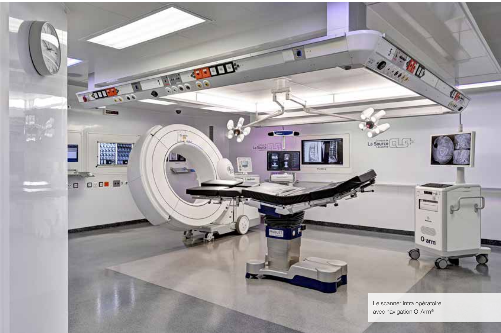
Le scanner intra opératoire avec navigation O-Arm®

D otées d'un équipement à la pointe de l'innovation, les 7 salles d'opération de La Source permettent une prise en charge rapide et efficace des patients, aussi bien pour des interventions programmées qu'en urgence. En activité 24h/24, 7j/7, les équipes chirurgicales et anesthésiques expérimentées garantissent une sécurité maximale et une qualité des soins irréprochable au sein du Bloc opératoire, sans oublier le confort du patient.