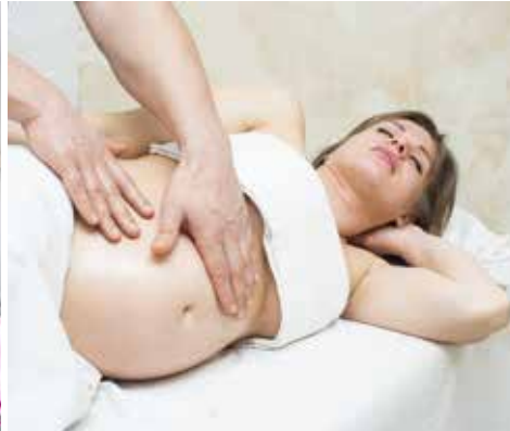
Fasciathérapie (branche douce de l'ostéopathie)