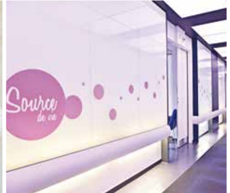
Jeux de lumières dans les couloirs