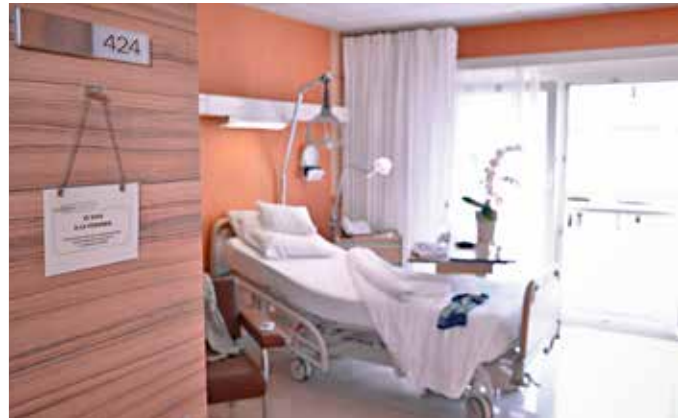
Les chambres disposent toutes d'une salle de bain et la plupart sont climatisées