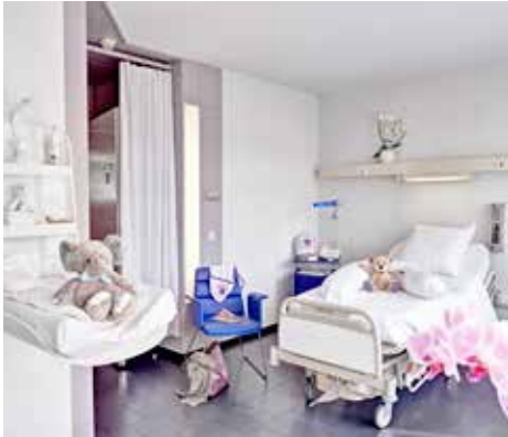
Chambre à un ou deux lits