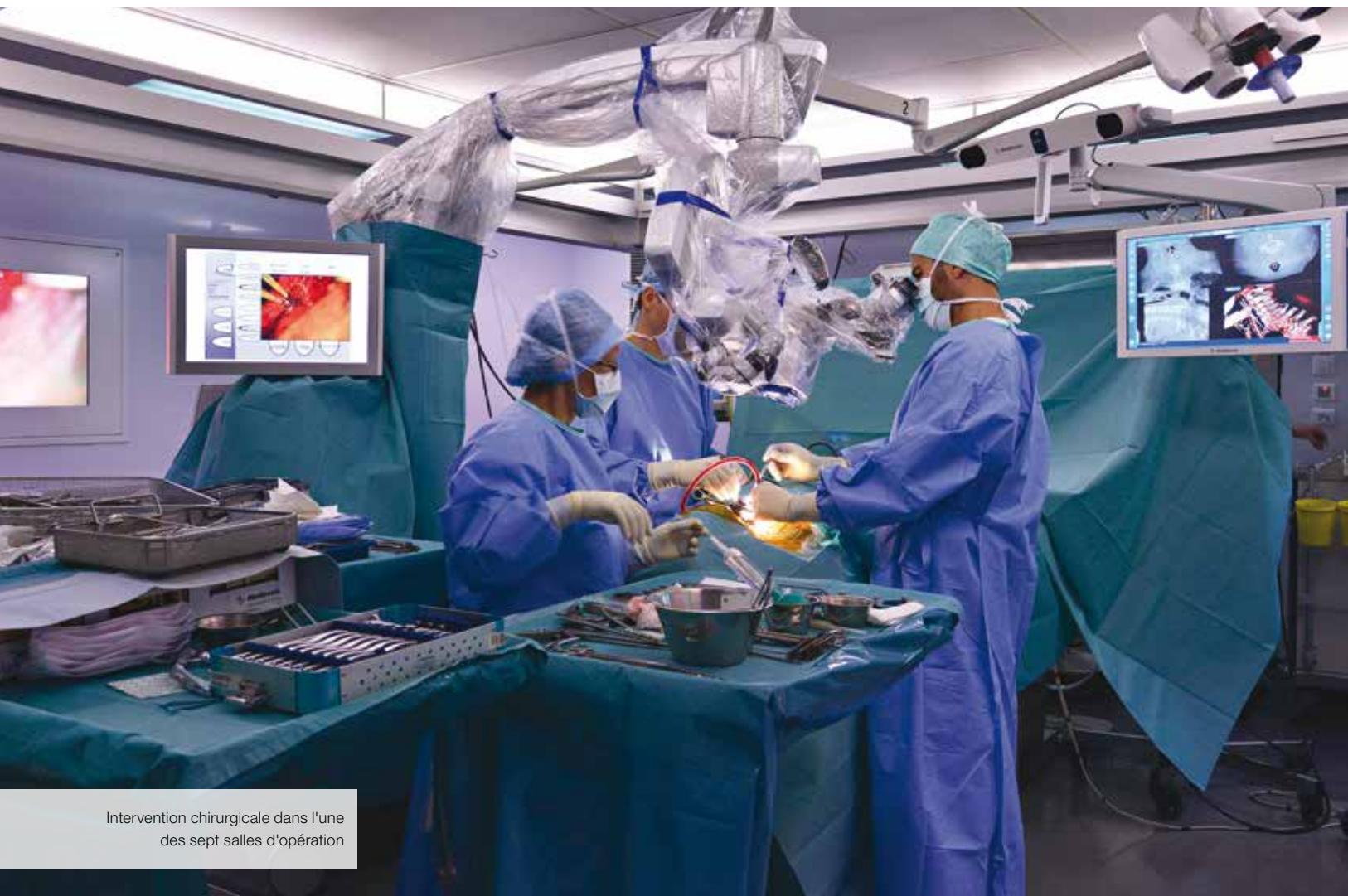
Intervention chirurgicale dans l'une des sept salles d'opération