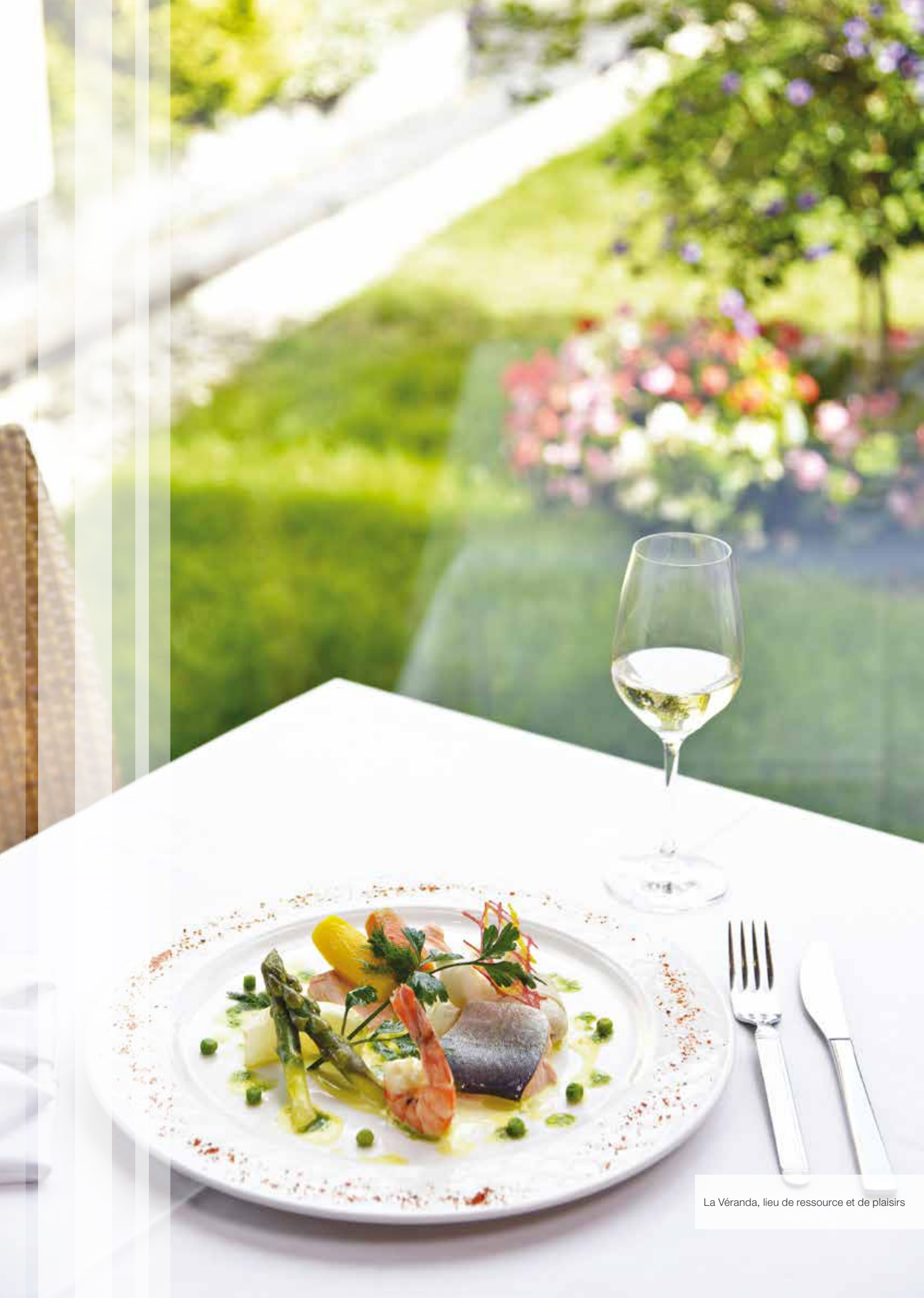
La Véranda, lieu de ressource et de plaisirs