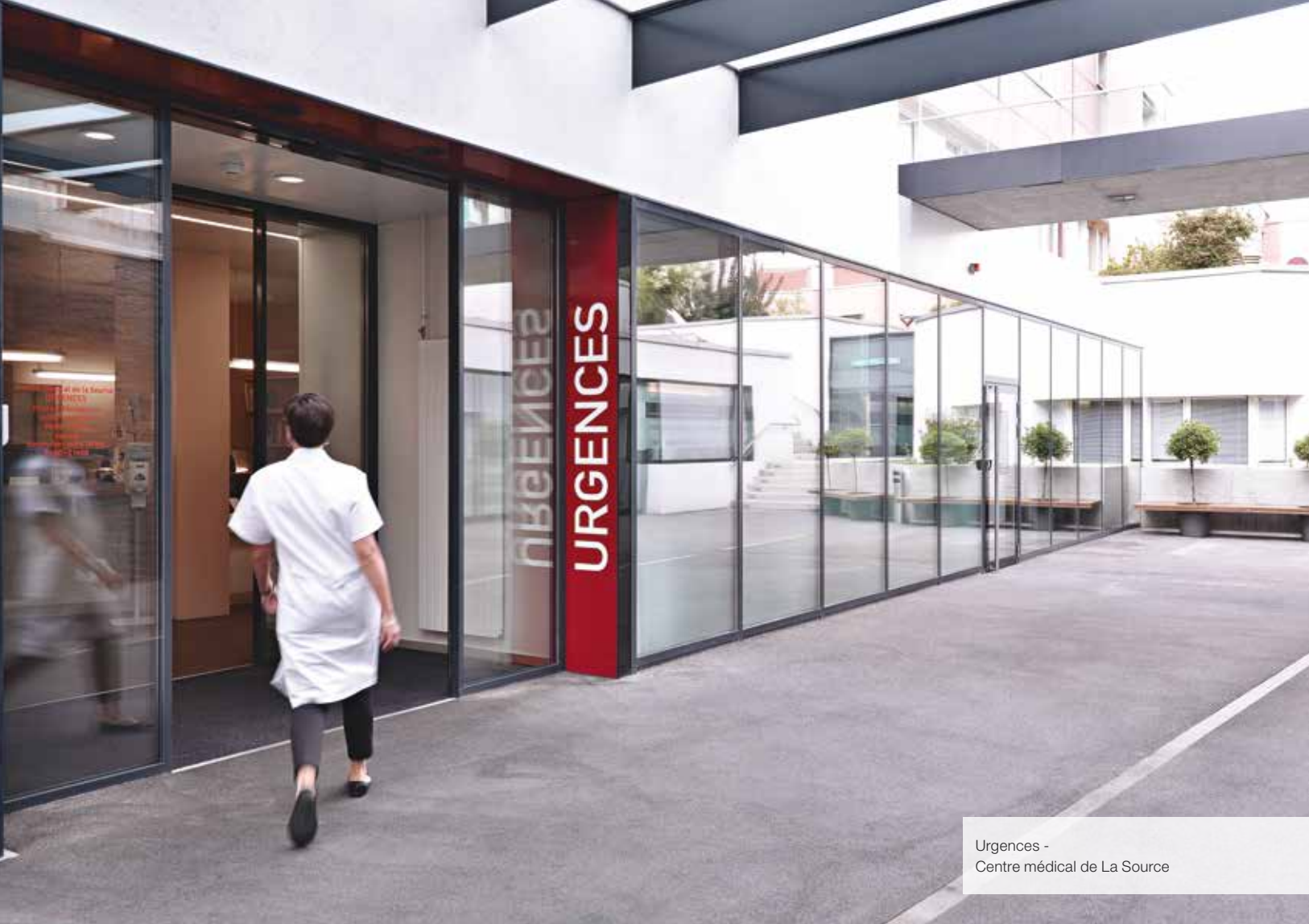
Urgences - Centre médical de La Source