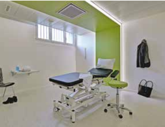
L'institut de physiothérapie