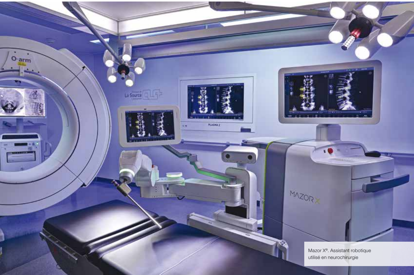
Mazor X®. Assistant robotique utilisé en neurochirurgie

« Les sept salles d'opération de La Source, toutes équipées à la pointe de la technologie, permettent une prise en charge rapide et efficace des patients »