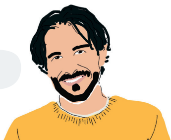
Créateur & Repreneur

→ Vous avez accès aux services exclusifs de l'association GSC : Fonds Social, assistance-emploi Mutuaide, rachat des points retraite pour les mandataires sociaux, etc.