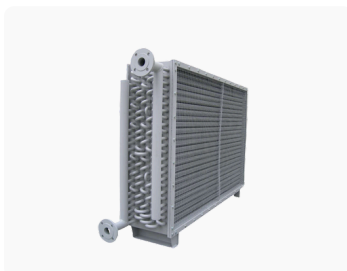
Batterie de récupération