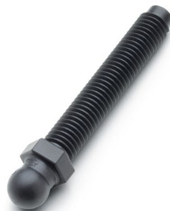
STP Tige pour pieds réglables