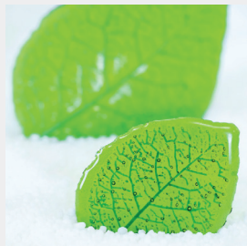
ES-TAMP Feuille Hêtre réf. 014021 Beech leaf