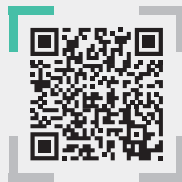
Recettes & vidéos Recipes and videos