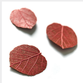
ES-TAMP Feuille Noisetier réf. 013794 Hazelnut tree leaf