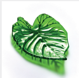
ES-TAMP Feuille Monstera réf. 014079 Monstera leaf