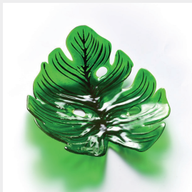
ES-TAMP Feuille Deliciosa réf. 014024 Deliciosa leaf