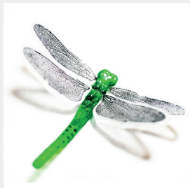
ES-TAMP Libellule réf. 014026 Dragonfly