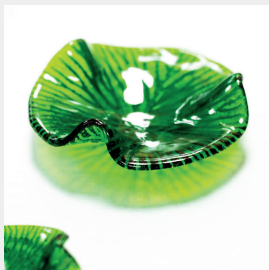
ES-TAMP Feuille Nénuphar réf. 014018 Water lily leaf