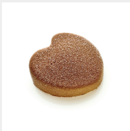
ES-TAMP Moule Amande réf. 013841 Almond mould