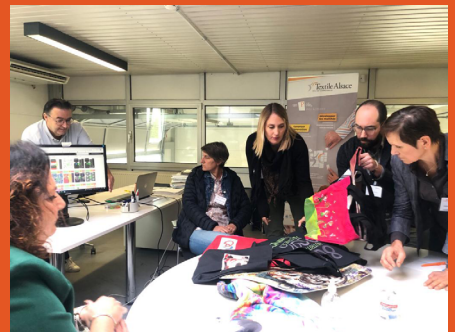
Brunch chez Trium Technology

Dans le cadre de la Feuille de route Textile Grand Est 2021-2023, le Pôle Textile Alsace a bénéficié d'un soutien financier de la Région Grand Est à hauteur de 360 270,00€ sur 3 ans, soit 37% des recettes de l'association.