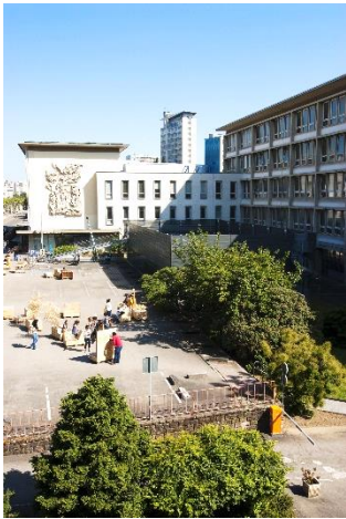
INSA STRASBOURG par K.Stober

L'Institut National des Sciences Appliquées Strasbourg (INSA Strasbourg) Appartenant au groupe INSA, l'INSA Strasbourg accueille environ 2 000 étudiant(e)s architectes et ingénieur(e)s sous statut étudiant ou statut apprenti ; nos spécialités ingénieurs en industrie : génie mécanique, plasturgie, mécatronique, génie électrique, en construction : génie thermique énergétique et environnement, génie civil, topographie.