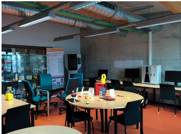
Plateforme innovation et ingénierie / FabLab

Big data et machine learning ; Systèmes IoT ; Systèmes multi tâches ; Automatique avancée ; Système on chip ; Algorithmes génétiques ; Systèmes multi-agents ; Chariot autonome sans conducteur ; Système de stockage et chargeur ; Vision et science des données ; Thermostats intelligents ; Matériaux pour impression 4D ; Fabrication par impression 3D ; Numérique et IA au travers d'outils et de modes collaboratifs dont le BIM ; Cartographie en IA ; Drone et IA ; IA et systèmes