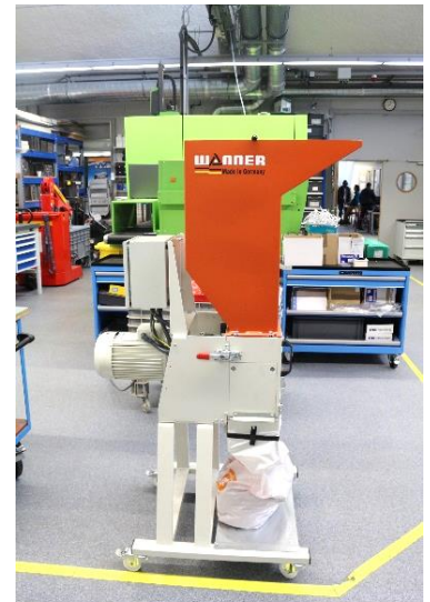
Broyeur recyclabilité (plateforme mécanique)

La spécialité génie électrique : les compétences acquises dans la spécialité génie électrique vont couvrir les domaines techniques tels que l'informatique, l'automatique, l'électronique de puissance, l'électrotechnique. Les problèmes d'économie d'énergie et la mise en œuvre des énergies renouvelables sont aussi étudiés. Trois parcours sont proposés en dernière année :