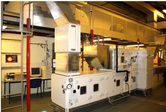
Structure de la plateforme aéroulrique et rénovation centrale traitement d'air (plateforme Climatherm)

La spécialité génie thermique, énergétique et environnement forme des ingénieurs climaticiens pour le secteur du bâtiment et de l'industrie, capables de concevoir des systèmes climatiques économes en énergie et à faible impact environnemental, d'assurer le suivi de leur réalisation et d'en piloter la gestion et la maintenance. Ces systèmes permettent la maîtrise de climats artificiels dans les bâtiments à usage d'habitation, tertiaire ou industriel.