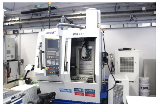
Centre d'usinage (Plateforme mécanique)