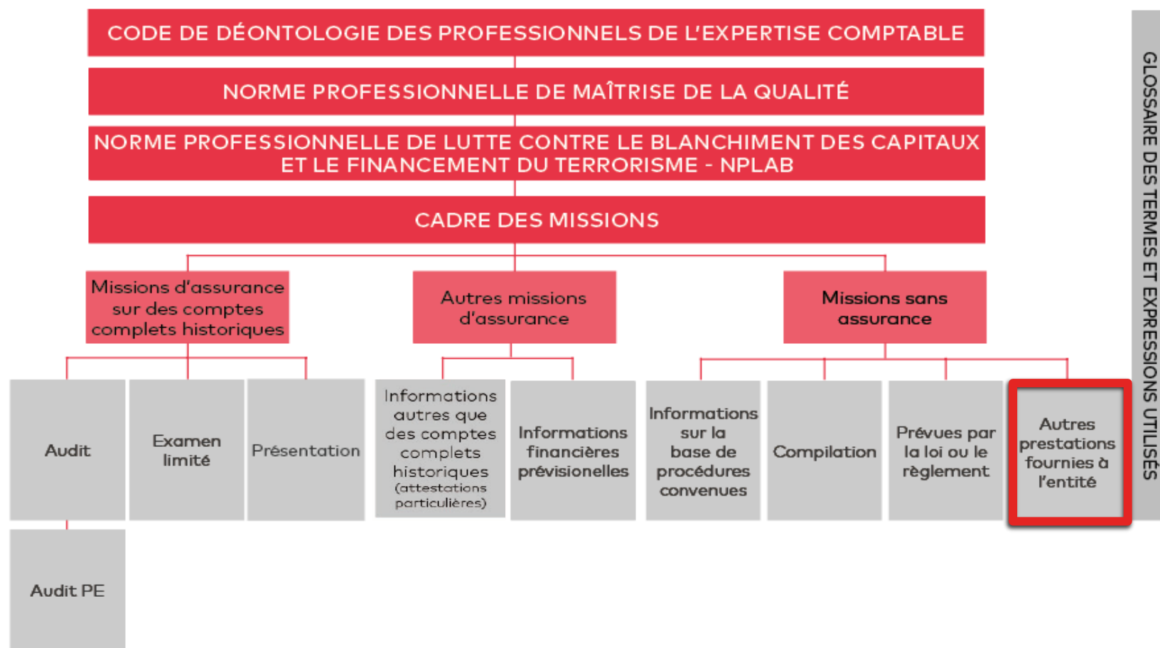
SCHÉMA GÉNÉRAL DU CADRE DE RÉFÉRENCE