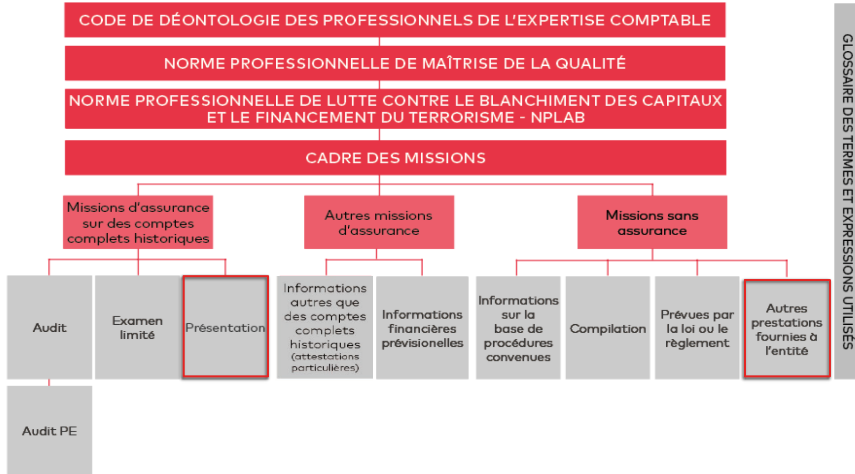
SCHÉMA GÉNÉRAL DU CADRE DE RÉFÉRENCE