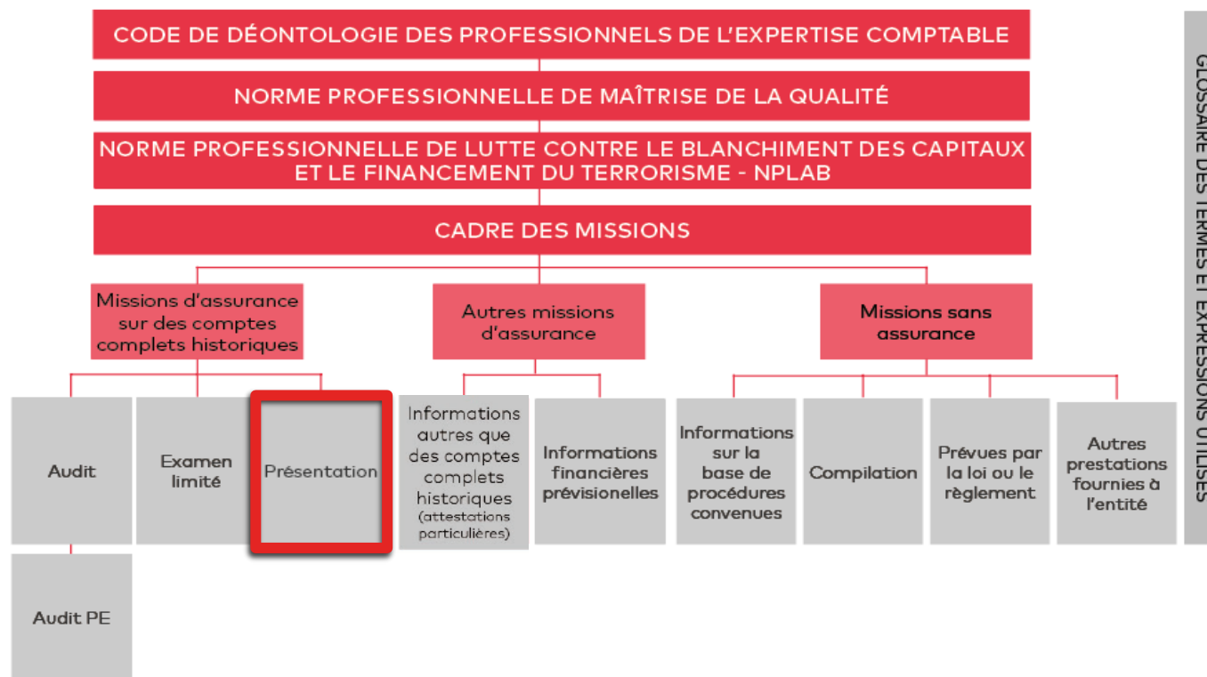
SCHÉMA GÉNÉRAL DU CADRE DE RÉFÉRENCE