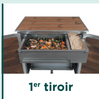
1 er tiroir

Le transfert du compost d'un tiroir à l'autre se fait très facilement avec l'ouverture d'un « fond mobile » sous chaque tiroir.