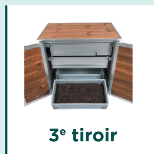
3 e tiroir