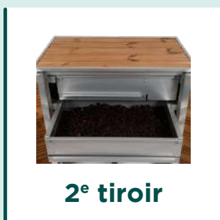
2 e tiroir