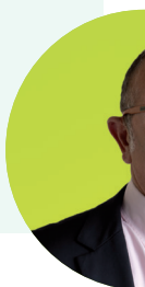
Christian Président Un