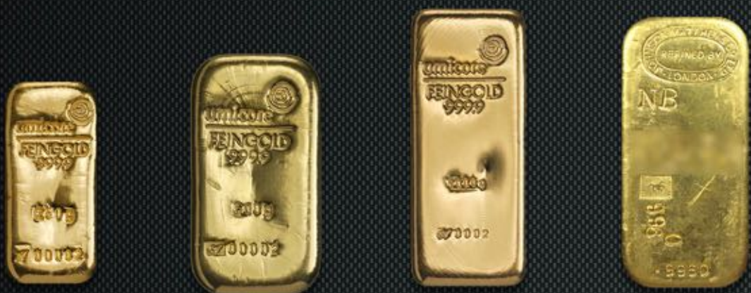
250g TITRE: 999,9/1000 500g TITRE: 999,9/1000 Lingot International Moderne TITRE: 999,9/1000 Lingot Français Ancien TITRE: 999,9/1000