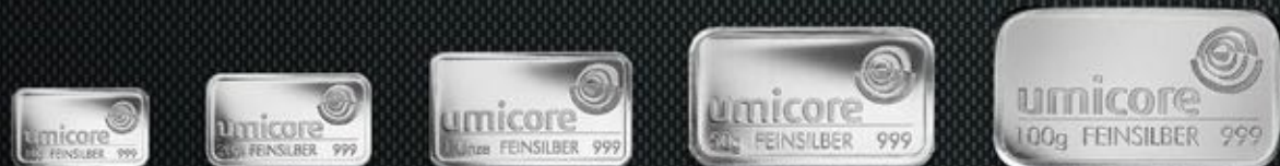
10g TITRE: 999,9/1000 20g TITRE: 999,9/1000 1oz TITRE: 999,9/1000 50g TITRE: 999,9/1000 100g TITRE: 999,9/1000