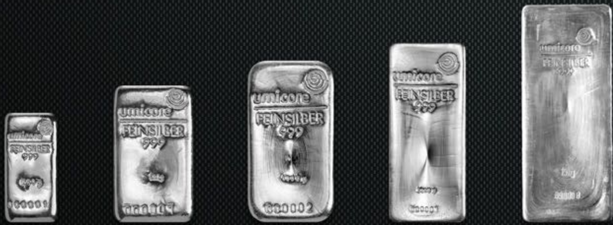
250g TITRE: 999,9/1000 500g TITRE: 999,9/1000 1kg TITRE: 999,9/1000 5kg TITRE: 999,9/1000 15kg TITRE: 999,9/1000