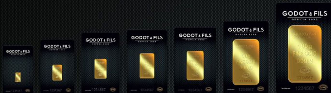
1g TITRE: 999,9/1000 5g TITRE: 999,9/1000 10g TITRE: 999,9/1000 20g TITRE: 999,9/1000 1oz TITRE: 999,9/1000 50g TITRE: 999,9/1000 100g TITRE: 999,9/1000