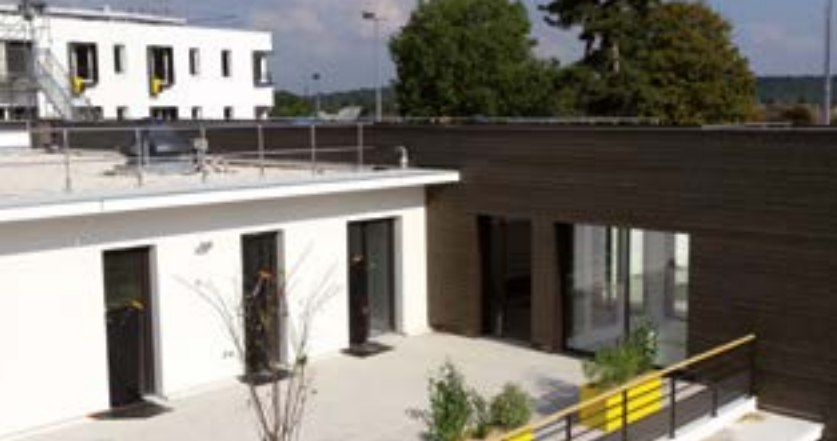
EHPAD Lépine Versailles à Versailles (78)