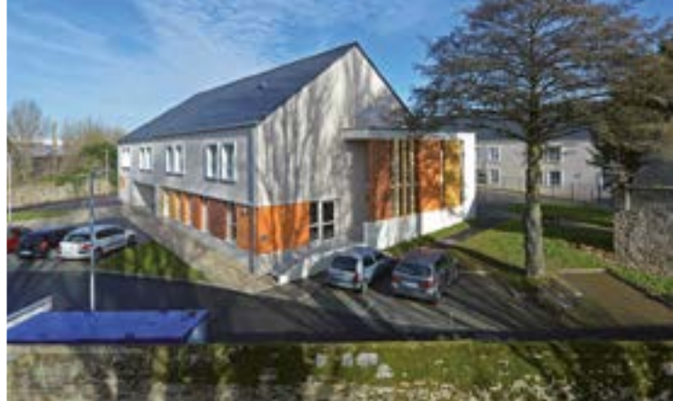
EHPAD Plessis-Pont-Pinel à Saint-Malo (35)