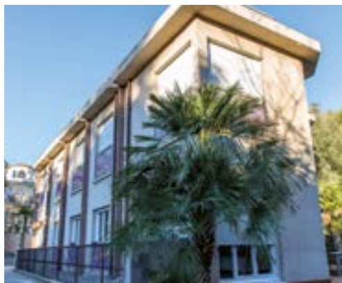
La Résidence Sainte-Claire à Caluire et Cuire (69)