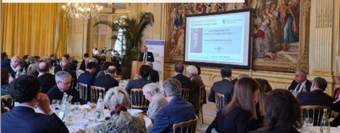
Déjeuner-débat avec François Villeroy de Galhau, Gouverneur de la Banque de France « La politique monétaire peut-elle vaincre l'inflation ? » Vendredi 17 février 2023 - Cercle de l'Union Interalliée

Vous partagez une vision de la finance durable au service du bien commun ?