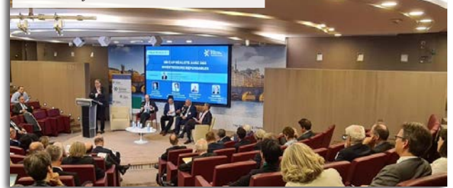
Colloque CILT - Réinventer la retraite Mercredi 8 juin 2022 - BNP Paribas AM

Au sein des Clubs, des groupes de travail et des Forums Mac Mahon, venez contribuer à des travaux de recherche en lien avec l'actualité et les enjeux économiques et financiers de demain.