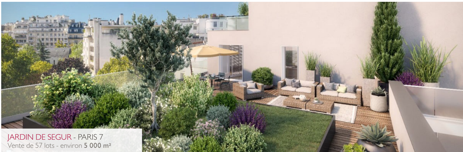
JARDIN DE SEGUR - PARIS 7 Vente de 57 lots - environ 5 000 m 2

Leader in sales before completion on the Parisian real estate market, Catella Residential Partners had to complete its offer with the launching of Catella Real Estate France: a department which will focus on sales of existing prestige Parisian real estates. High end, tailor-made customer service, exceptional locations, magnificent views, charming Parisian architecture... Our experienced team is determined to conquer shares in the luxury market segment.