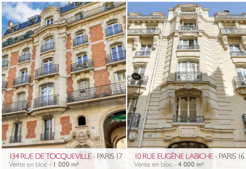
134 RUE DE TOCQUEVILLE - PARIS 17 Vente en bloc - 1 000 m 2

Our team will advise these groups in terms of strategy development for sales or acquisitions, and will support them through each step of the process until the transaction has been finalised.