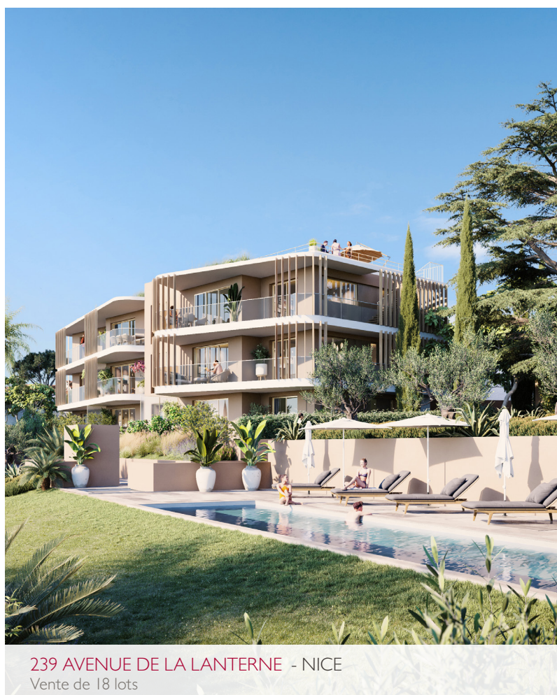
239 AVENUE DE LA LANTERNE - NICE Vente de 18 lots