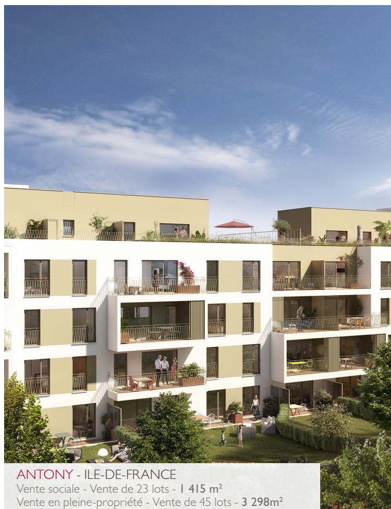
ANTONY - ILE-DE-FRANCE

Vente sociale - Vente de 23 lots - 1 415 m 2