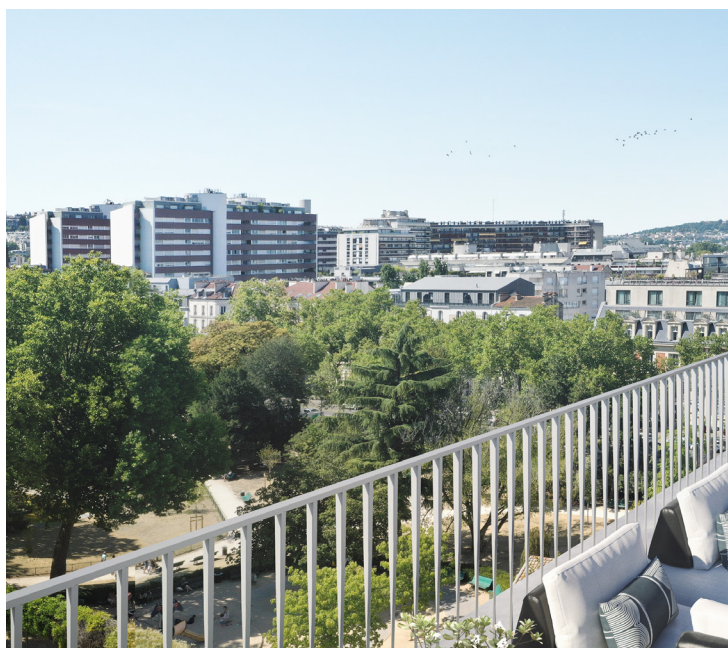
PASSAGE CHATEAUDUN - BOULOGNE-BILLAN COURT (92) Vente de 65 lots