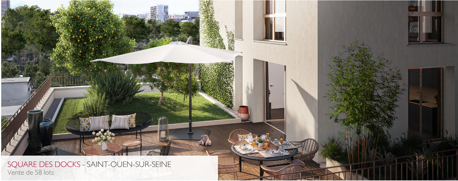
SQUARE DES DOCKS - SAINT-OUEN-SUR-SEINE Vente de 58 lots

Recently, Catella Residential Partners has completed its offer with the innovative and attractive "Bail réel Solidaire" (BRS) leasehold arrangement. The idea is to purchase housing without paying for the land it stands on. 25 to 40% rebate on sale prices are to be expected. BRS helps balance the real estate market in high tension areas, and allows lower income families to access private home ownership.