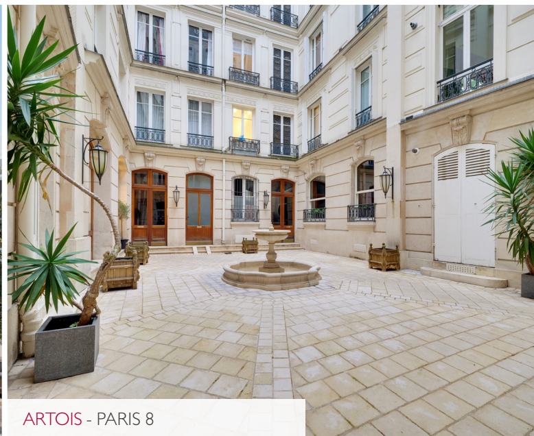
ARTOIS - PARIS 8