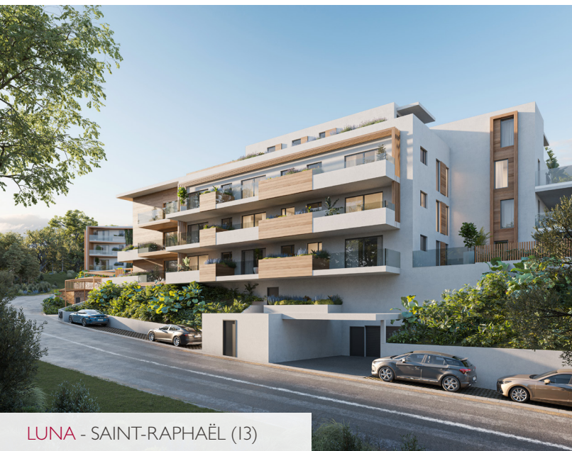
LUNA - SAINT-RAPHAËL (13)