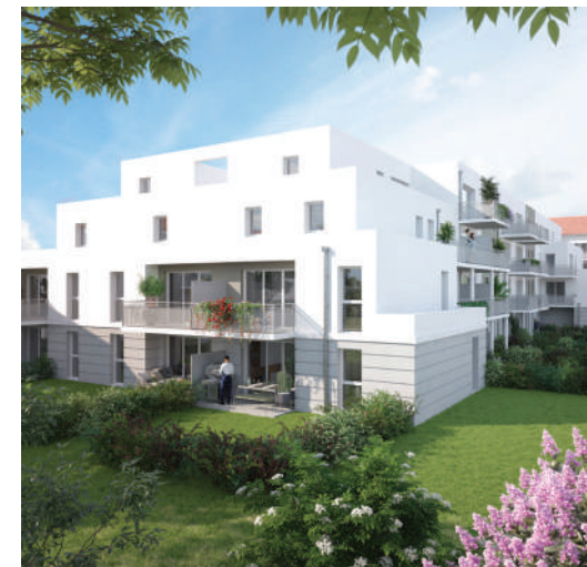
Nuance Carmin Perpignan (66) 98 logements