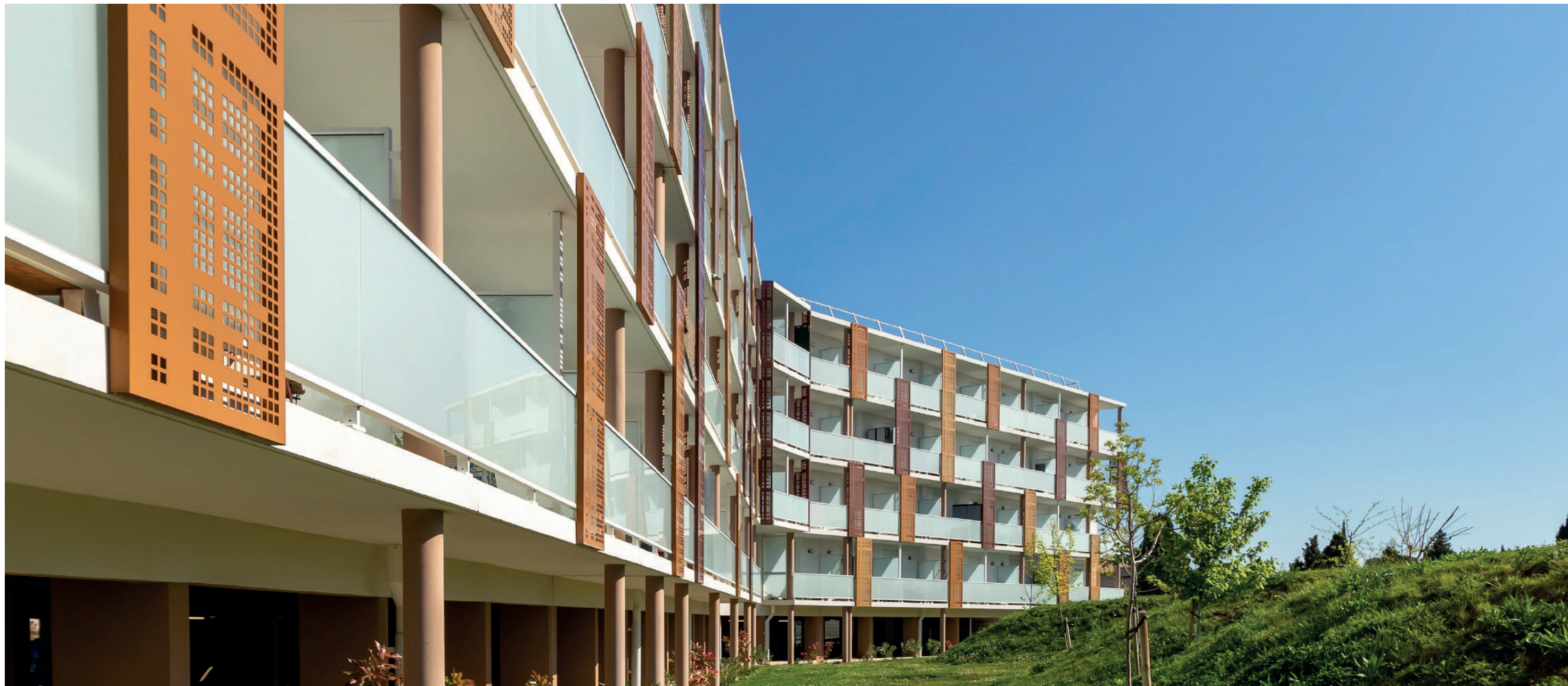
Résidence étudiante L'Amphi - Nîmes (30) - 188 logements