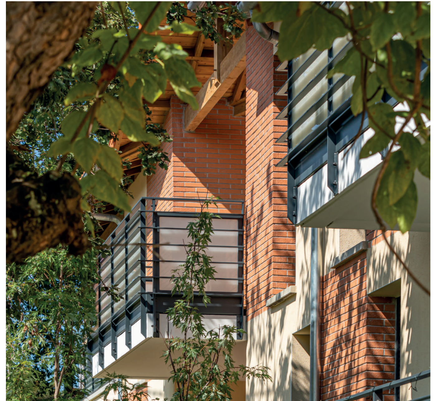
Naturéa - Plaisance-du-Touch (31) - 15 logements

Modernes et lumineuses, nos réalisations se déclinent en logements allant du T1 au T5, en harmonie avec leur environnement. Nos résidences bénéficient de prestations de standing pour le plus grand confort des occupants et revisitent le style architectural local dans le respect des normes environnementales en vigueur.