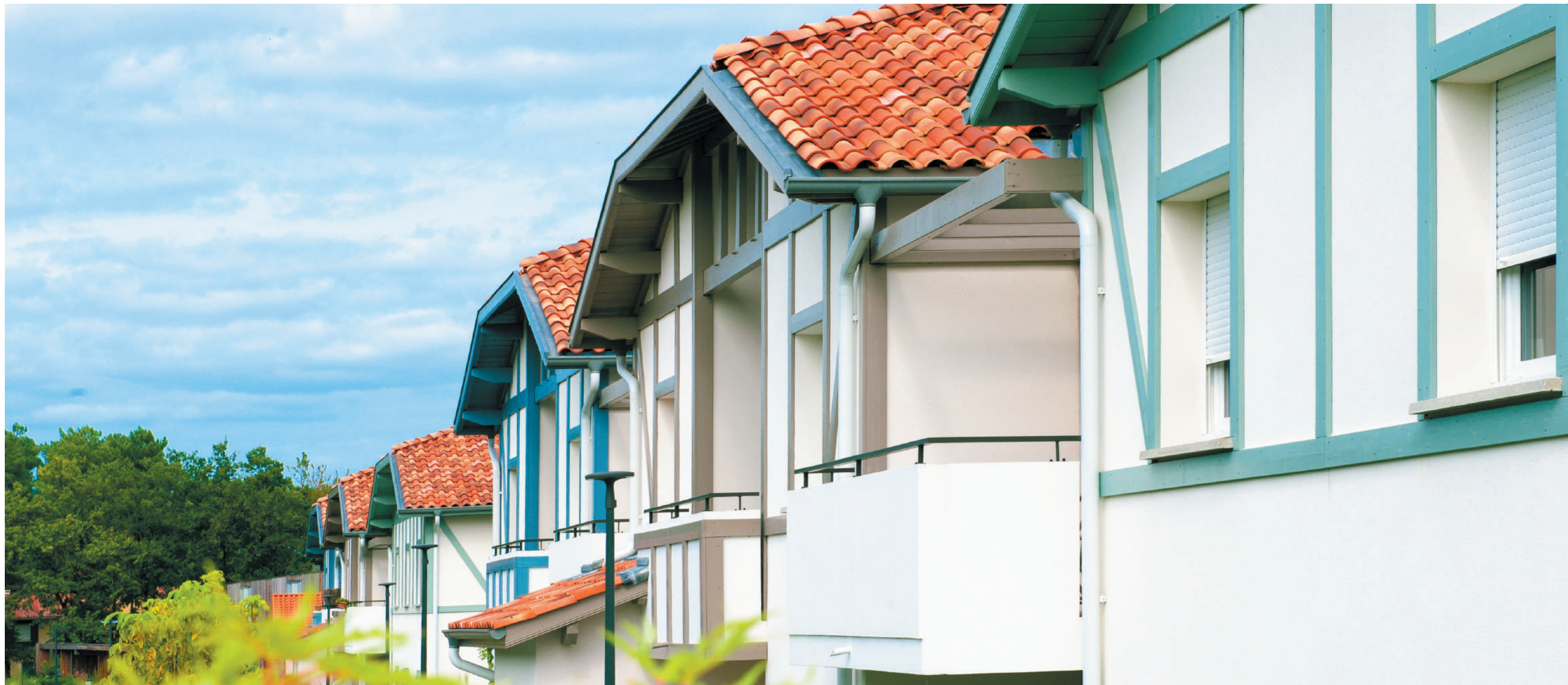
Résidence Arboréa - Bénése-Maremne (40) - 38 logements