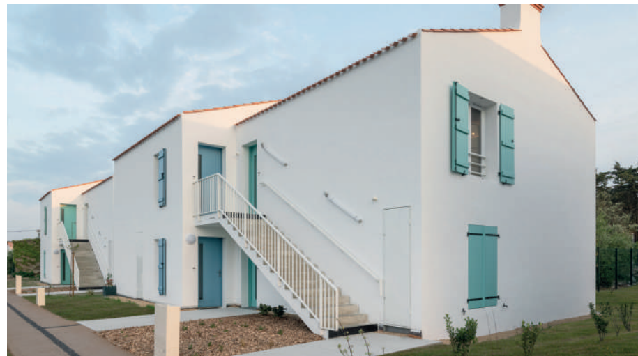
Esprit Longère Noirmoutier-en-l'Île (85) 35 logements