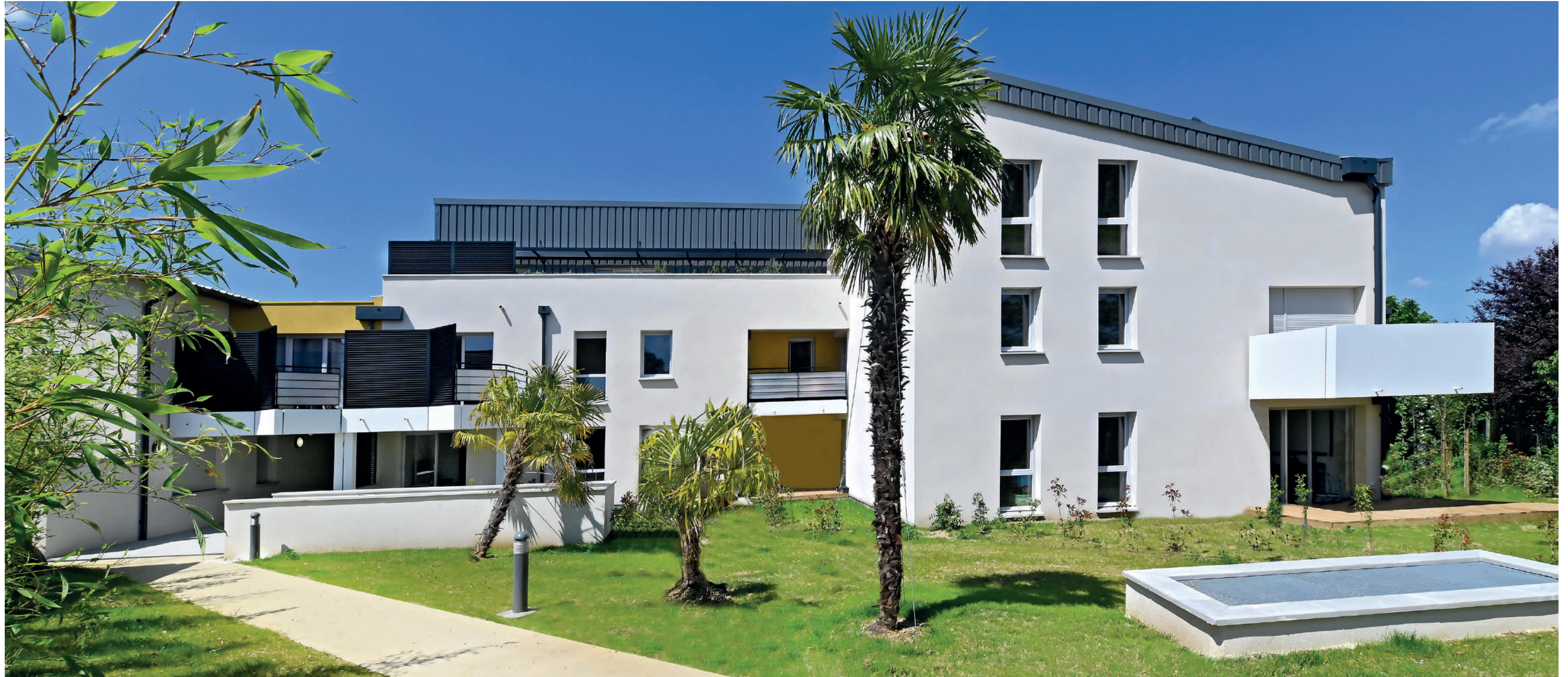
So City - Colomiers (31) - 38 logements