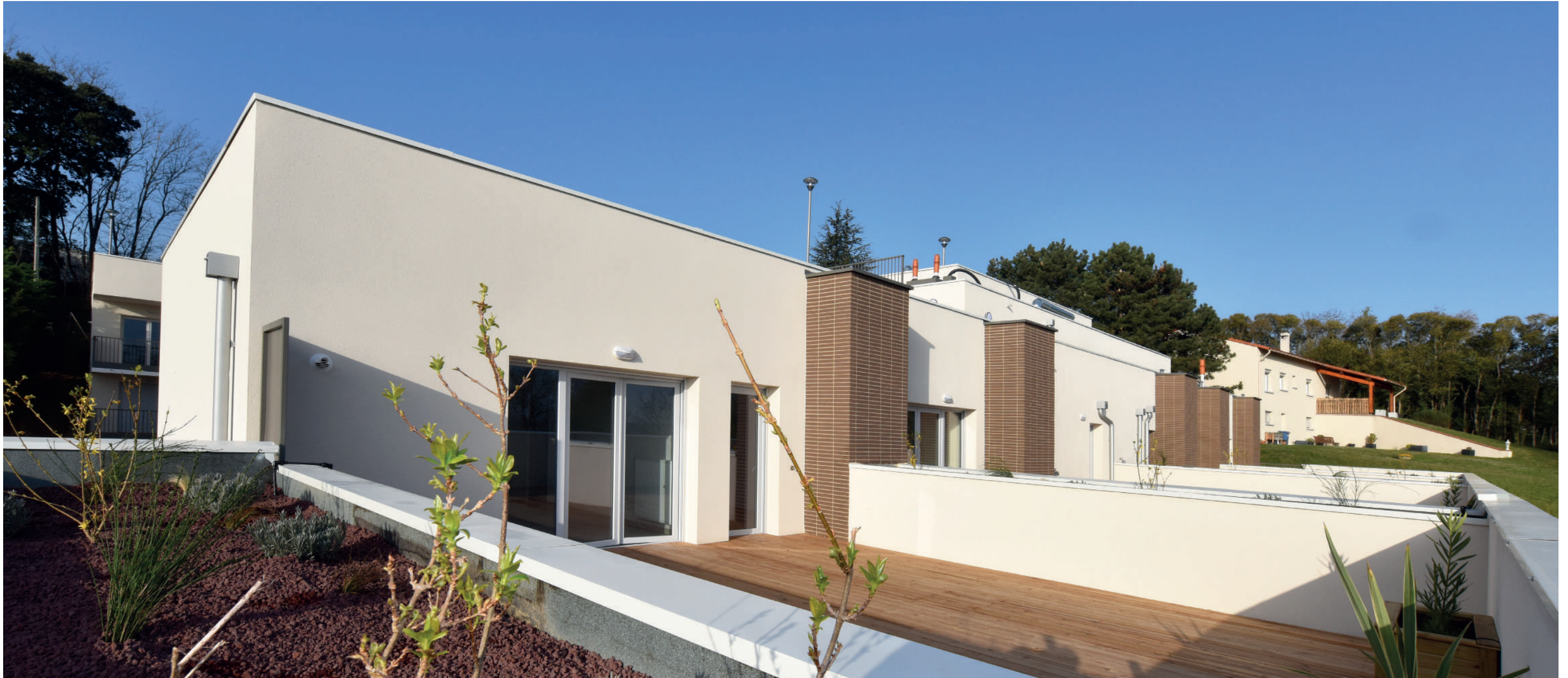
Plein Ciel - Toulouse (31) - 32 logements