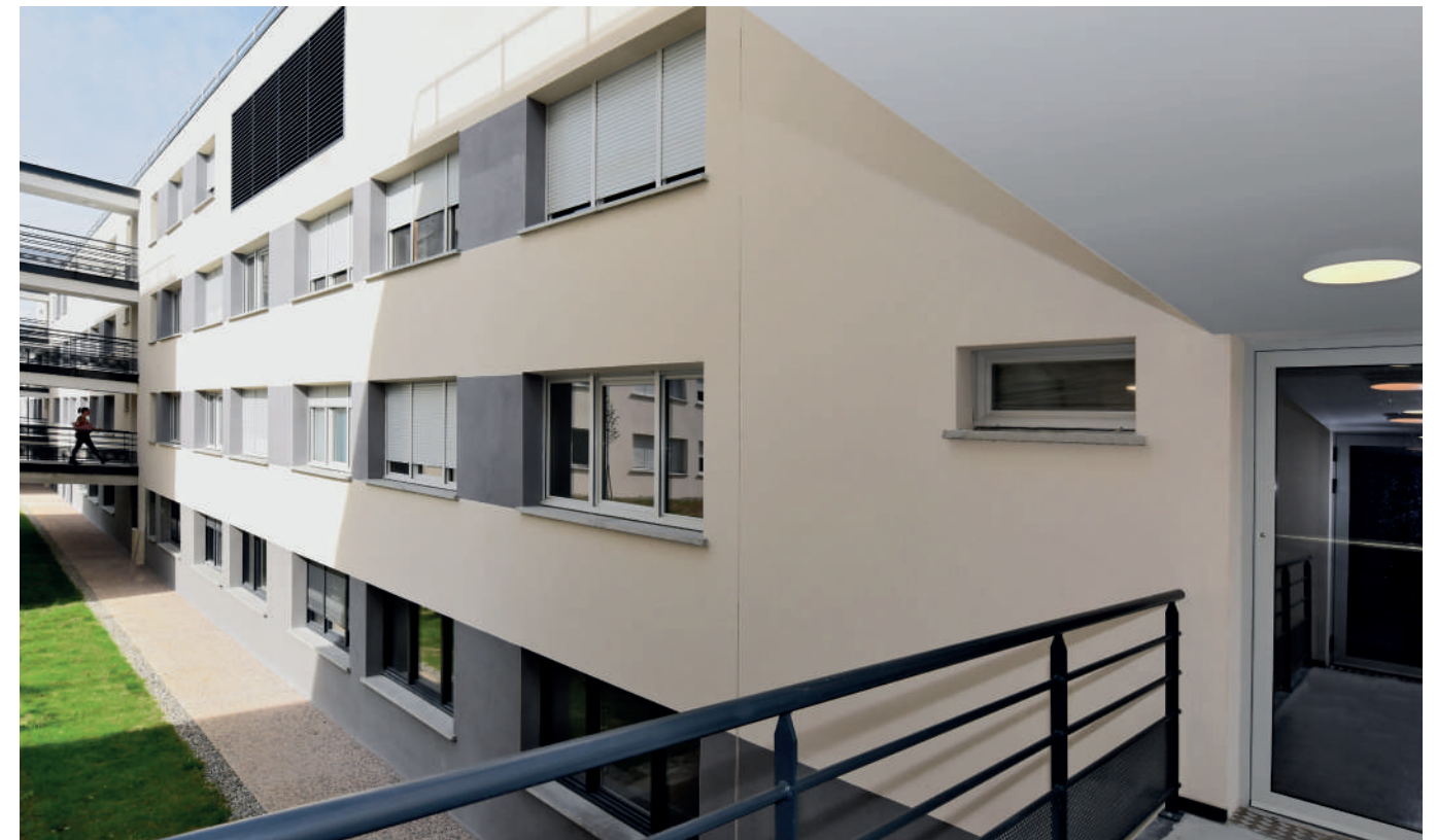
Résidence étudiante Study Ô Auzeville-Tolosane (31) 234 logements