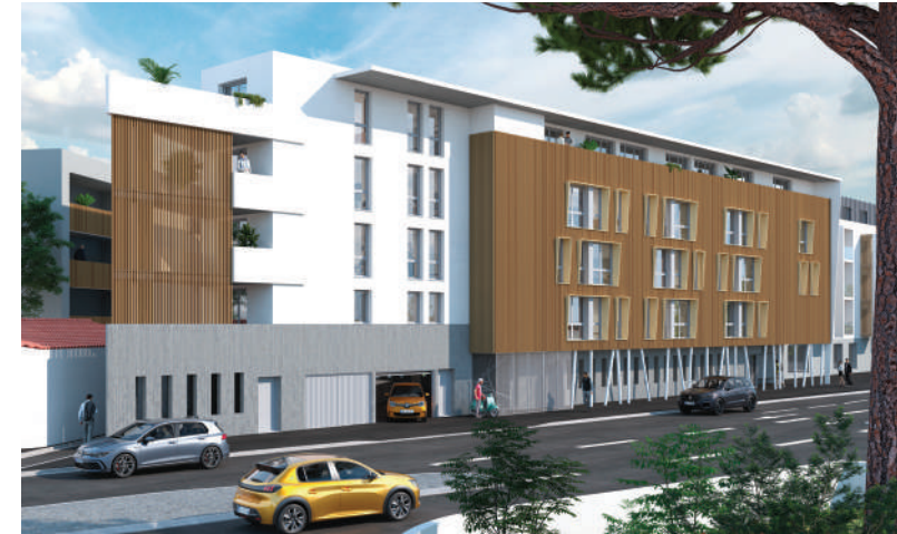
Résidence étudiante Graph Study La Rochelle (17) 67 logements

Situées dans les grandes villes universitaires de France, à proximité des principaux pôles d'enseignement supérieur, nos résidences étudiantes proposent des logements équipés, meublés, confortables et fonctionnels. Elles sont agrémentées de services adaptés aux besoins des étudiants : laverie, cafétéria, salle de sport, conciergerie, local vélos.