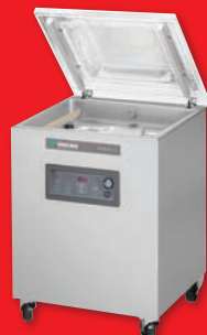
Machine sous vide