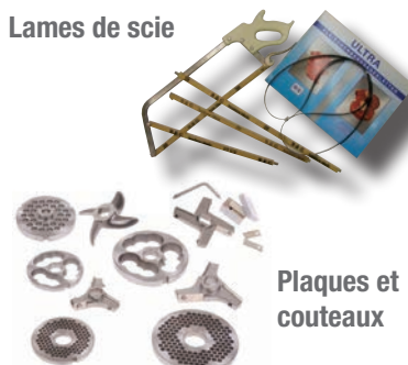
Plaques et couteaux