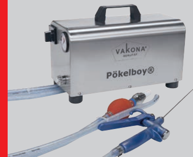
Pompe à saler