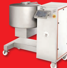
Baratte - Mélangeur