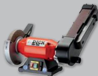
Affûteuse à bande