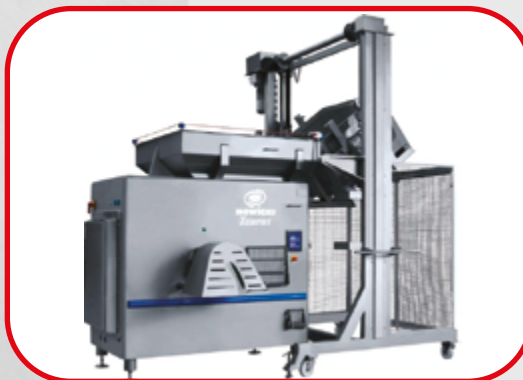
Hachoir automatique avec élévateur