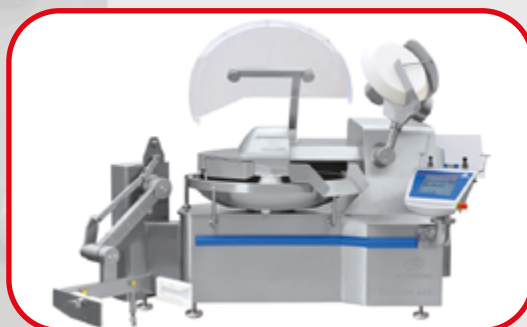
Cutter de 125 à 500 litres