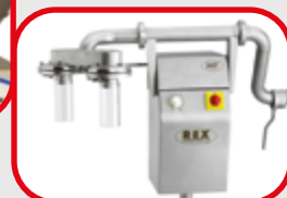
formeuse à diaphragme (boulettes, quenelles)