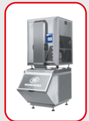
Générateur à glace WL500

Et aussi : • Machine à couper les viandes congelées • Machines à précouper les viandes fraîches ou semi-congelées en cubes • Egreneur • Distributeur de sel • Tapis de transfert • Tapis peseur • Vis sans fin