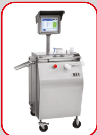
Séparatrice à saucisses