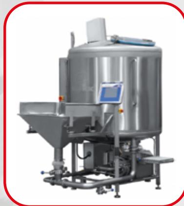
Mélangeur de saumure