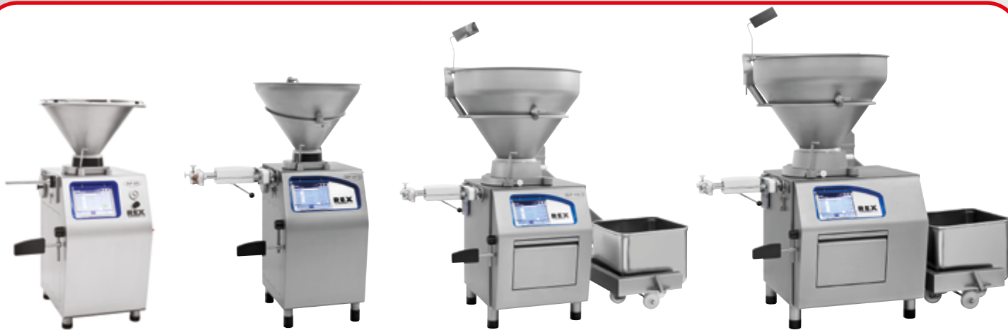
Série RVF 200

Une nouvelle génération de poussoirs continus sous vide, une gamme complète adaptée de l'artisanat à l'industrie.