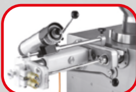
enfileur à boyaux