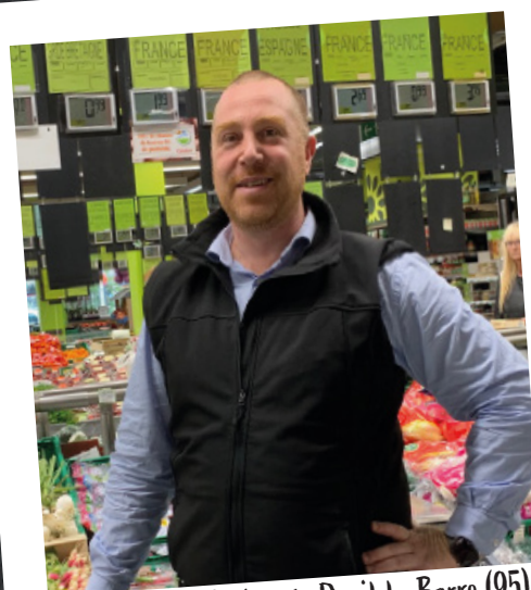
Supermarché Casino de Deuil-la-Barre (95)

« J'ai choisi la location-gérance car cette formule permet de se tester dans la gestion d'entreprise. J'avais déjà la conviction de vouloir devenir chef d'entreprise, mais il me manquait la confirmation que cela était réalisable. C'est donc un bon équilibre entre la part de risque et l'engagement personnel. Les premiers résultats économiques sont encourageants. J'ai appris beaucoup de choses sur la façon de gérer un magasin, une entreprise. Mon projet serait d'acquérir un fonds de commerce. Je souhaite devenir franchisé, avoir mon propre magasin. Les trois premières années en location-gérance ont confirmé et conforté mon souhait d'être mon propre patron. »