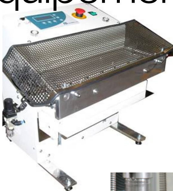
SCELLEUSE DES TUBES

MÉLANGEUR HOMOGÉNÉISATEUR SOUS VIDE & À DOUBLE ENVELOPPE POUR LA FONTE