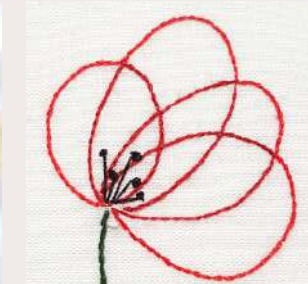
COQUELICOT ONE LINE ONE LINE POPPY