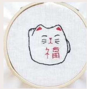
MANEKI NEKO MANEKI NEKO