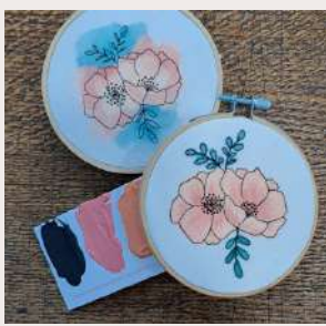
PAVOT NOIR BLACK watercolor poppy