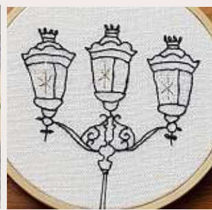
LAMPADAIRE PARISIAN LIGHTS