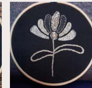
FLEUR BRODERIE OR

Modèles COLLECTION AQUARELLE : tous nos kits comprennent un livret d'explication français/anglais, le dessin à reproduire sur le tissu, le tissu (lin italien ou coton) les fils de soie et/ou métallisés AU VER A SOIE, l'aiguille BOHIN FRANCE et une cartonnnette avec les couleurs aquarelle LA NOUVELLE VAGUE COULEURS. Kit au choix : avec ou sans tambour (bambou en 10 cm). Emballage dans boîte kraft recyclé et recyclable environ 12 x 12 cm.