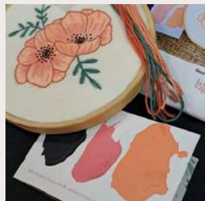
PAVOT COULEUR silky watercolor poppy