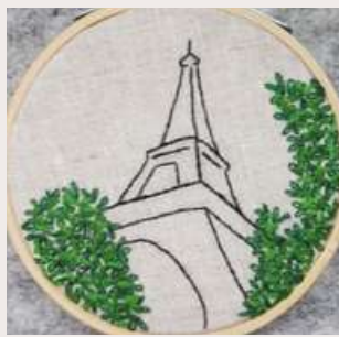
TOUR EIFFEL EIFFEL TOWER