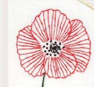
COQUELICOT MODERNE MODERN POPPY