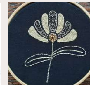
FLEUR SOIE ET PERLES