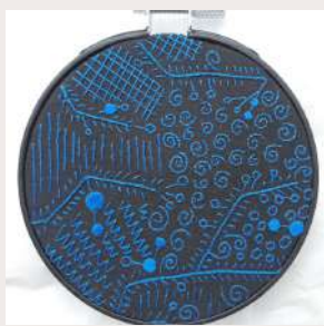
HOMMAGE A L'AMAZONIE