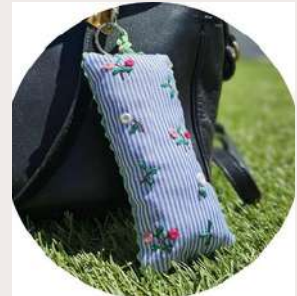
FLEURS ET RAYURES