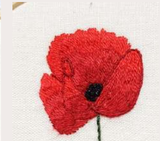
COQUELICOT POETIQUE - POETIC POPPY

Modèles COLLECTION COUTURE : tous nos kits comprennent un livret d'explication français/anglais, toutes les fournitures nécessaires (fils AU VER A SOIE, perles, cannetille et autres matières éventuelles, les tissus, l'aiguille BOHIN FRANCE). Kit au choix : avec ou sans tambour. Emballage dans boîte kraft recyclé et recyclable environ 12 x 12 cm ou sachet plastique selon modèle .