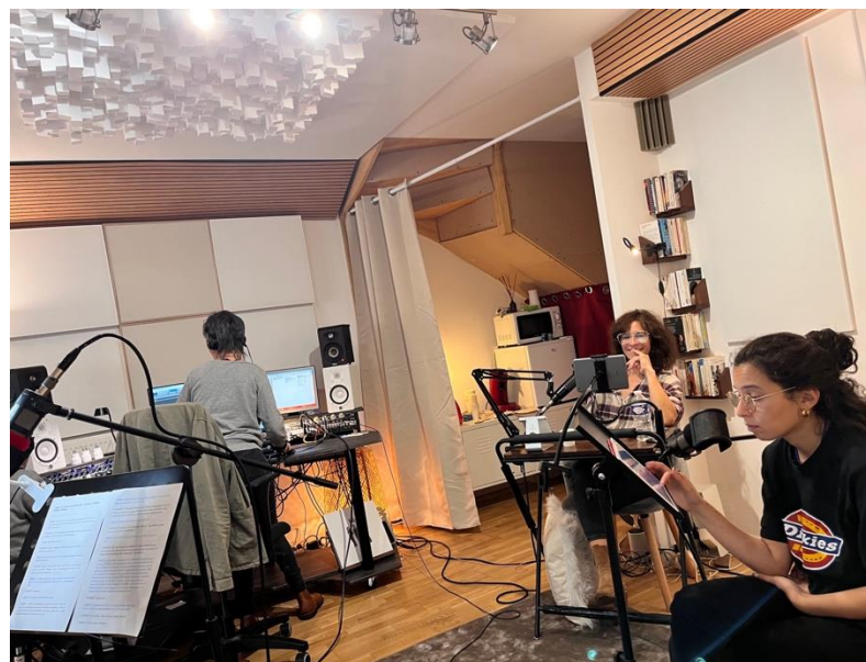
Enregistrement des voix du parcours sonore jeune public du Musée National de l'Histoire de L'Immigration du Palais de la Porte Dorée - 2023