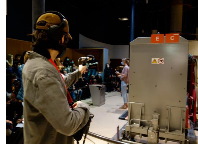
Prises de son au Palais de la Découverte