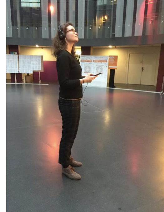
Parcours sonore géolocalisé « Visite ludique de la Maison de la Radio », à destination des familles, conçu pour Radio France

Depuis 2014, notre expertise s'exerce auprès de musées, de producteurs d'expériences immersives, d'institutions et de sites culturels, patrimoniaux et touristiques, de collectivités et de territoires, d'entreprises souhaitant valoriser leur savoir-faire et leur identité ou souhaitant s'adresser à des visiteurs ou à des clients d'une façon originale.