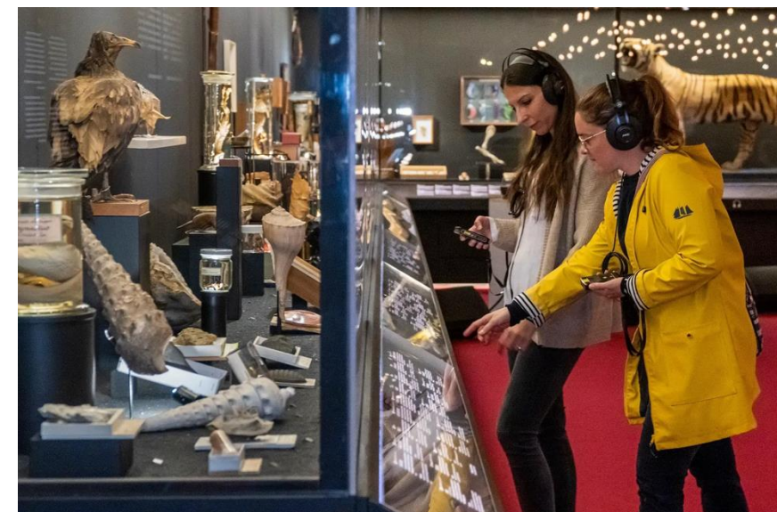
Parcours sonore de l'exposition « Trésors », à destination des enfants et des familles, conçu pour le Muséum de Genève, en Français et en Anglais, en partenariat avec les archives musicales du MEG (Musée d'Ethnographie de Genève) - 2023