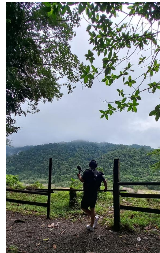
Session d'enregistrement au Costa Rica