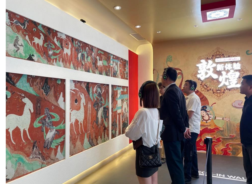
Créations sonores en son 3D orienté sur l'histoire et le patrimoine chinois, réalisées pour le stand de China Mobile lors d'un salon sur l'IA et les nouvelles technologies, à Pékin - 2024