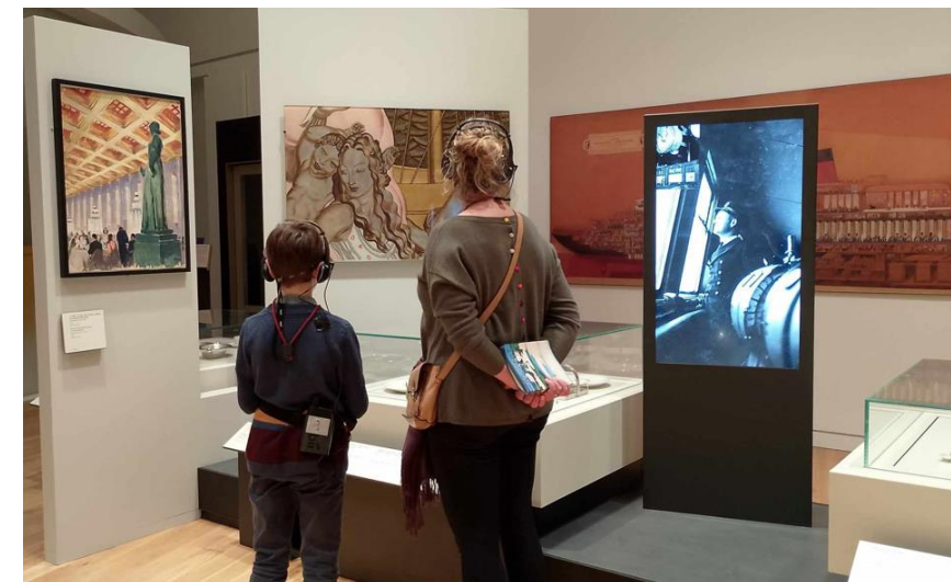
Parcours sonore jeune public du Musée national de la Marine pour la découverte des collections permanentes, au Palais de Chaillot, à Paris