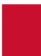
Pantone rouge 186 C