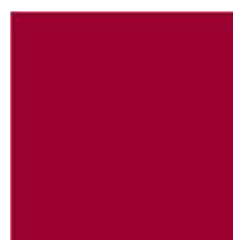
Pantone rouge 7427 C T'sac réf. 1373