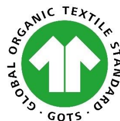
Logo 3 : Fibres et fils en coton biologique