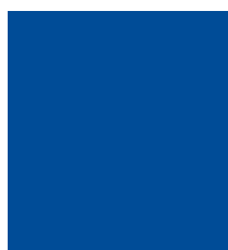
Pantone bleu 2945 C T'sac réf. 1264