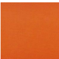
Pantone orange 166 C Chic cabas réf. 1282