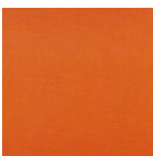
Pantone orange 166 C cabas réf. 1973