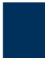
Pantone bleu 540 C