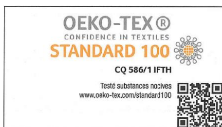
Logo 2 : Tissage et ennoblisseurs