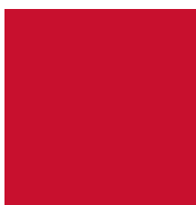
Pantone rouge 186 C T'sac réf. 1263