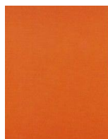
Pantone orange 166 C