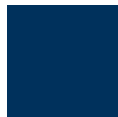
Pantone bleu 540 C