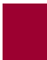
Pantone rouge 7427 C