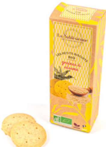
LE SABLÉ AUX GRAINES DE SÈSAME

Étui de sablés aux graines de sésame 110g BIO et Vegan / Sablés biscuits with sesam seeds en sachets fraîcheur / in individual packs Gencod : 3585730034398 12 uvc/carton DDM 10 mois Réf : F1BSE01