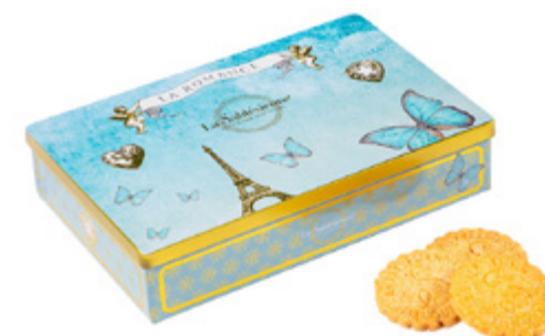
LA BOÎTE ROMANCE

Boîte Louison à Paris, 150g / Louison in Paris tin Sablés aux pépites de chocolat, en sachets fraîcheur/ Sablés biscuits with chocolate chips, individual packs. Gencod : 3585730036095 12 UCV / carton DDM 12 mois Ref: F1SPC63