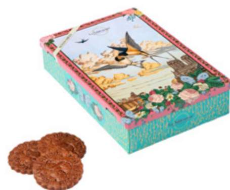
LA BOÎTE CIEL DE PARIS

Boîte Ciel de Paris 150g / Sky of Paris tin Sablés tout chocolat, en sachets fraîcheur/ All chocolate sablés biscuits, individual packs. Gencod : 3585730036101 12 UCV / carton DDM 12 mois Ref: F1STC08