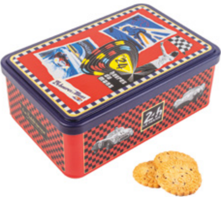
LA BOÎTE 24H ÉDITION 1960