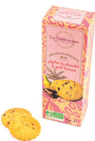
LE SABLÉ AUX PÉPITES DE CHOCOLAT ET BANANE

Étui de sablés pépites de chocolat et banane 110g BIO et Vegan / Sablés biscuits with chocolate chips and banana chips en sachets fraîcheur / in individual packs Gencod : 3585730032783 12 uvc/carton DDM 10 mois Réf : F1BCB02