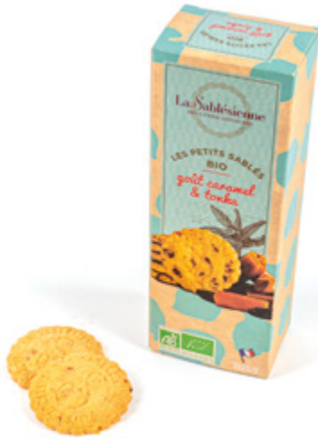
LE SABLÉ CARAMEL BEURRE SALÉ ET FÈVE TONKA

Étui de sablés caramel beurre salé et fève tonka 110g BIO / Sablés biscuits with caramel chips and tonka bean en sachets fraîcheur / in individual packs Gencod : 3585730032790 12 uvc/carton DDM 10 mois Réf : F1BCT02