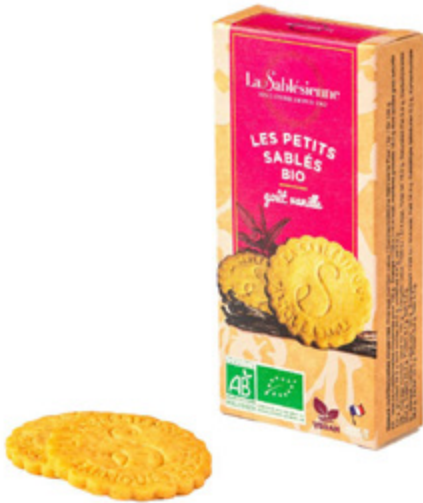
LE SABLÉ VANILLE

Étui de sablés vanille 37g BIO et Vegan / Sablés biscuits with vanilla case en sachets fraîcheur / in individual packs Gencod : 3585730033087 24 uvc/PAV DDM 10 mois Réf : F1BVA16