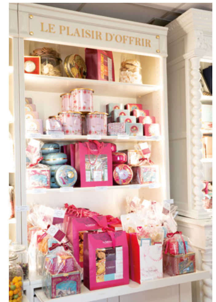
Exemple d'implantation La Sablésienne