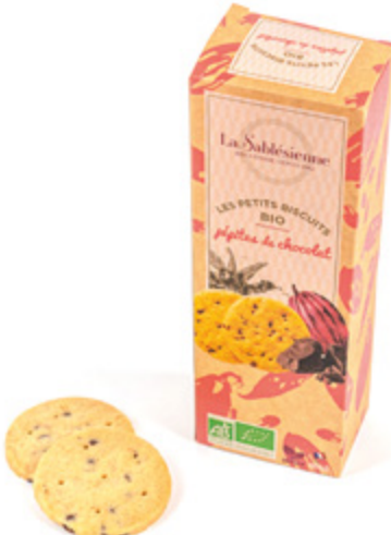
LE SABLÉ AUX PÉPITES DE CHOCOLAT

Étui de sablés aux pépites de chocolat 110g BIO et Vegan / Sablés biscuits with chocolat chips en sachets fraîcheur / in individual packs Gencod : 3585730034367 12 uvc/carton DDM 10 mois Réf : F1BPC02