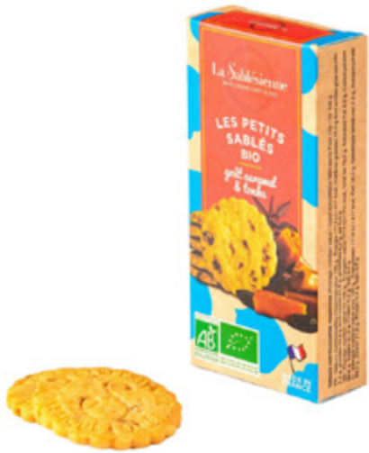
LE SABLÉ CARAMEL BEURRE SALÉ ET FÈVE TONKA

Étui de sablés caramel beurre salé et fève tonka 37g BIO / Sablés biscuits with caramel chips and tonka bean en sachets fraîcheur / in individual packs Gencod : 3585730033100 24 uvc/PAV DDM 10 mois Réf : F1BCT04