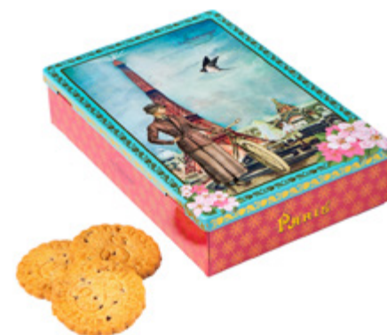
LA BOÎTE LOUISON À PARIS

Boîte Ciel de Paris 150g / Sky of Paris tin Sablés tout chocolat, en sachets fraîcheur/ All chocolate sablés biscuits, individual packs. Gencod : 3585730036101 12 UCV / carton DDM 12 mois Ref: F1STC08