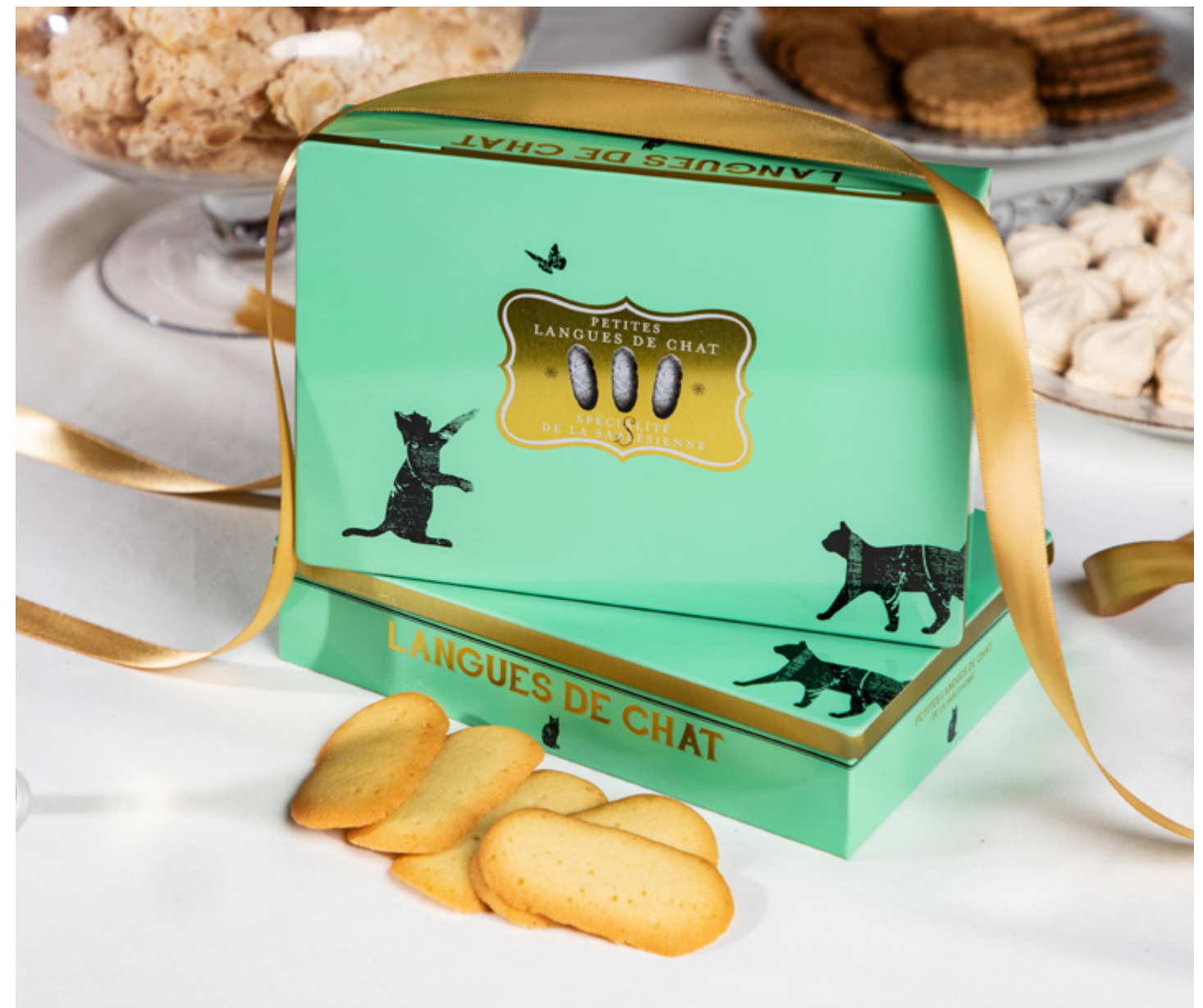
LA BOÎTE MÉTAL LANGUES DE CHAT