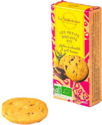
LE SABLÉ AUX PÉPITES DE CHOCOLAT ET BANANE

Étui de sablés pépites de chocolat et banane 55g BIO et Vegan / Sablés biscuits with chocolate chips and banana chips en sachets fraîcheur / in individual packs Gencod : 3585730033094 24 uvc/PAV DDM 10 mois Réf : F1BCB04