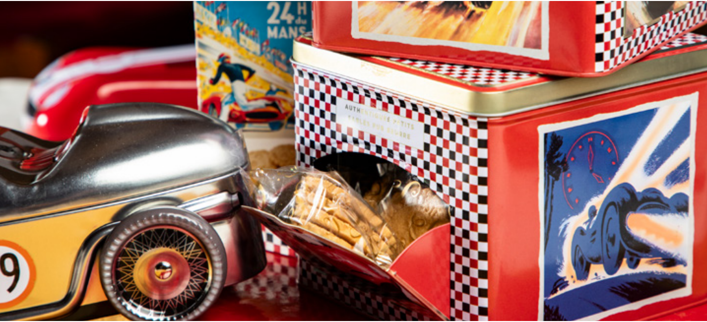
BOÎTE 24H DU MANS