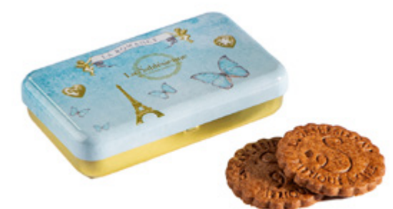
MINI BOÎTE ROMANCE

Boîte Romance 150g / Romance tin Sablésaux pépites de caramel, en sachets fraîcheur / Sablés biscuits with caramel chips, individual packs. Gencod : 3585730036002 12 UCV / carton DDM 12 mois Ref: F1SCA60