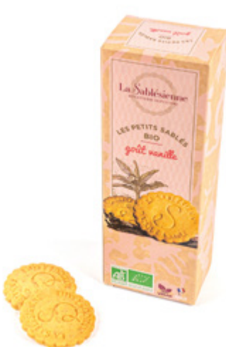
LE SABLÉ VANILLE

Étui de sablés vanille 110g BIO et Vegan / Sablés biscuits with vanilla en sachets fraîcheur / in individual packs Gencod : 3585730032776 12 uvc/carton DDM 10 mois Réf : F1BVA14