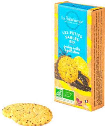
LE SABLÉ CITRON ET GRAINES DE CHIA

Étui de sablés citron et graines de chia 37g BIO et Vegan / Sablés biscuits with lemon and chia seeds en sachets fraîcheur / in individual packs Gencod : 3585730033070 24 uvc/PAV DDM 10 mois Réf : F1BCC04