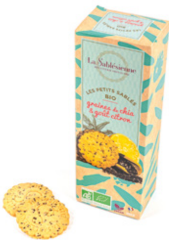
LE SABLÉ CITRON ET GRAINES DE CHIA

Étui de sablés citron et graines de chia 110g BIO et Vegan / Sablés biscuits with lemon and chia seeds en sachets fraîcheur / in individual packs Gencod : 3585730032769 12 uvc/carton DDM 10 mois Réf : F1BCC02