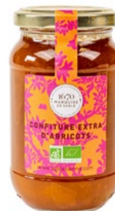
Confiture extra d'abricots 320g / Apricot jam Gencod : 3585730034442 9 uvc/carton DDM 4 ans Ref : F3CON20