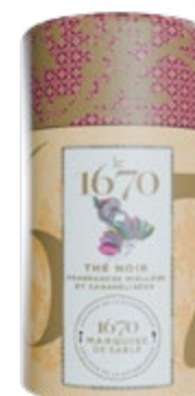
Thé noir fragrances miellées et caramélisées 50g / Black tea with honey and caramelised flavours Gencod : 3585730038259 12 uvc/carton DDM 23 mois Ref : F3TBV34