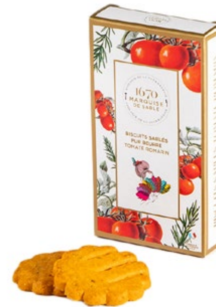
Étui Sablés salés tomate et romarin 20g / Savoury cookies tomato and rosemary Gencod : 3585730037016 36 uvc/carton DDM 6 mois Ref : F2STR01