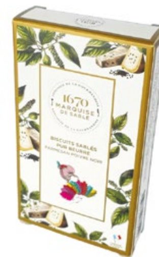
Étui Sablés salés parmesan AOP et poivre noir 20g / Savoury cookie parmesan cheese and black pepper 20g Gencod : 3585730038129 36 uvc/carton DDM 6 mois Ref : F1SPP19