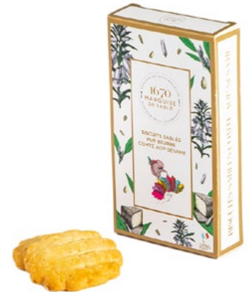
Étui Sablés salés comté AOP et sésame 20g / Savoury cookie comté cheese and sesame seeds Gencod : 3585730037146 36 uvc/carton DDM 6 mois Ref : F1SSC20