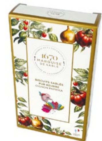
Étui Sablés salés oignon et paprika 20g / Savoury cookies onion and paprika Gencod : 3585730038112 36 uvc/carton DDM 6 mois Ref : F1SOP17