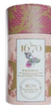
Rooibos fruits exotiques et fruits rouges, pétales de roses et de bleuets 50g / Rooibos with exotic fruits and red berries, rose petals and cornflower petals Gencod : 3585730038242 12 uvc/carton DDM 23 mois Ref : F3TBV33