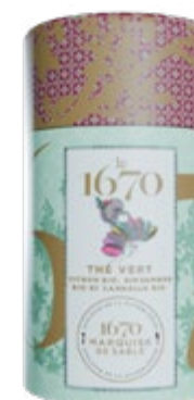
Thé vert citron bio, gingembre bio et cannelle bio 50g / Organic lemon green tea, organic ginger and organic cinnamon Gencod : 3585730038235 12 uvc/carton DDM 23 mois Ref : F3TBV32