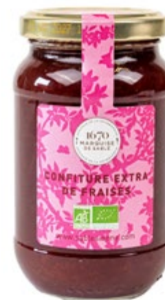
Confiture extra de fraises 320g / Strawberry jam Gencod : 3585730034435 9 uvc/carton DDM 4 ans Ref : F3CON22