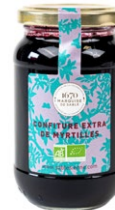
Confiture extra de myrtilles 320g / Blueberry jam Gencod : 3585730034459 9 uvc/carton DDM 4 ans Ref : F3CON24