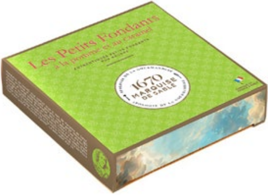
Fondants pomme caramel 80g / Fondants with apple and caramel chips Gencod : 3585730038341 12 uvc/carton DDM 10 mois Ref : F1DPO01