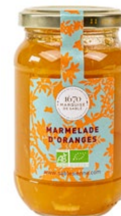
Marmelade d'oranges 320g / Orange marmalade Gencod : 3585730001666 9 uvc/carton DDM 4 ans Ref : F3CON25