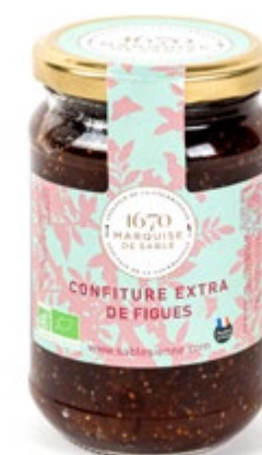
Confiture extra de figes 320g / Fig jam Gencod : 3585730001703 9 uvc/carton DDM 4 ans Ref : F3CON21