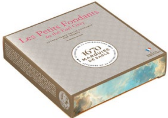
Fondants Thé Earl Grey / Fondants Earl Grey tea Gencod : 3585730038358 12 uvc/carton DDM 10 mois Ref : F1DTH01