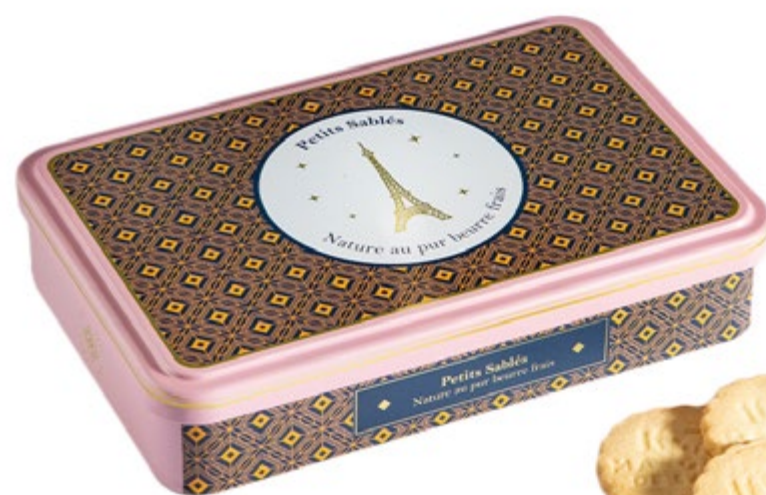
Boîte Tour Eiffel 150g / Eiffel Tower tin Sablés nature au pur beurre frais / fresh butter sablés biscuits Gencod : 3585730036965 18 uvc/carton DDM 14 mois Ref : F1SNA248

Tous nos petits sablés sont emballés dans des sachets fraîcheur avec filagramme doré