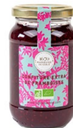
Confiture extra de framboises 320g / Raspberry jam Gencod : 3585730001697 9 uvc/carton DDM 4 ans Ref : F3CON23