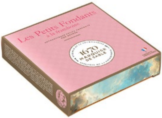
Fondants à la framboise 80g / Fondants with raspberry chips Gencod : 3585730038327 12 uvc/carton DDM 10 mois Ref : F1DFR06

Les Fondants Les étuis Tous nos petits sablés sont emballés dans des sachets fraîcheur avec filagramme doré