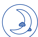
TRAVAIL DE NUIT