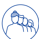
TRAVAIL EN ÉQUIPES SUCCESSIVES ALTERNANTES

L'exposition des salariés à un ou plusieurs des 6 facteurs de risque doit être déclarée si elle dépasse les seuils réglementaires.