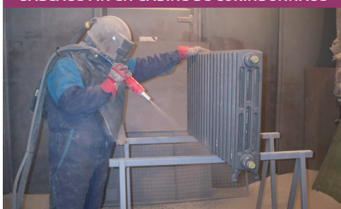
Lg 6000 - lg 4000 - Ht 2750 mm