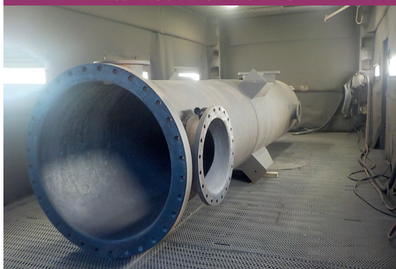
Lg 8000 - lg 4000 - Ht 3000 mm