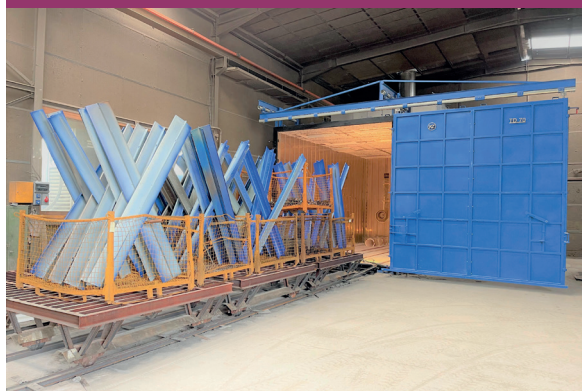
Lg 7000 - lg 3400 - Hauteur 3000 mm