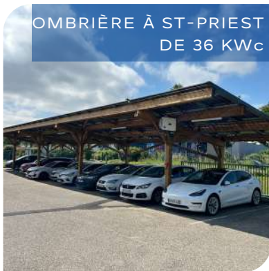
OMBRIÈRE À ST-PIEST DE 36 KWc