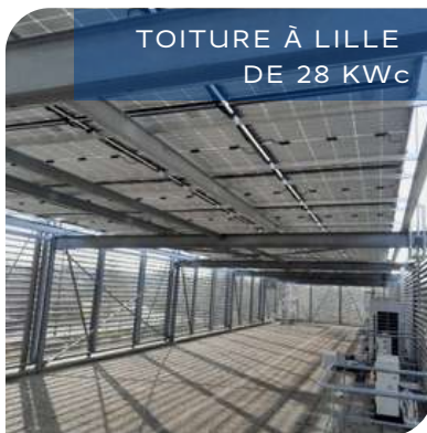
TOITURE À LILLE DE 28 KWc