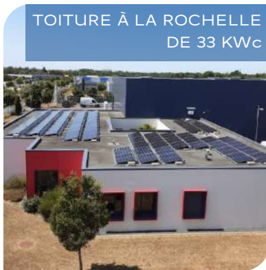
TOITURE À LA ROCHELLE DE 33 KWc