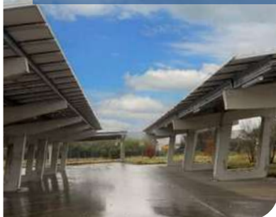
OMBRIÈRE À FECAMP DE 250 KWc