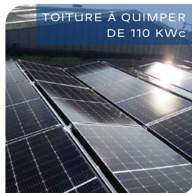
TOITURE À QUIMPER DE 110 KWc