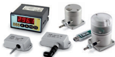
Capteurs de surveillance et inclinomètres.