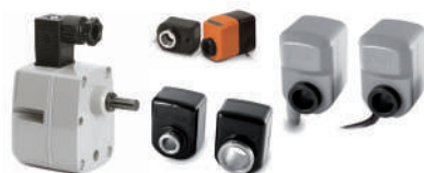
Transducteurs potentiométriques et incrémentiels à tige.