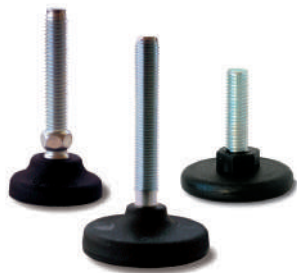
Embases plastique et caoutchouc Ø 19 à 175 mm. Tiges filetées M8 à M30.