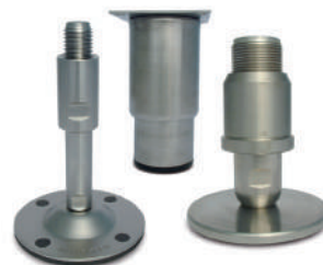
Teknoclean et pieds de cuves.