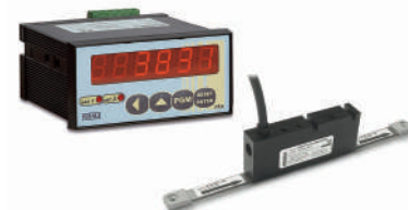
Systèmes incrémentaux absolus à bande magnétique.