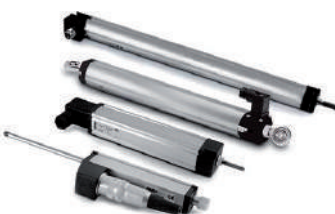
Transducteurs potentiométriques et incrémentiels à tige.