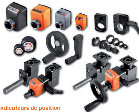
Indicateurs de position à arbre creux et accessoires.

Sélection de produits issus d'une large gamme. Consultez-nous pour plus d'informations.