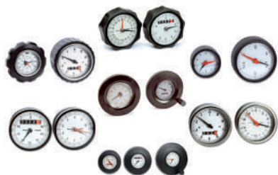
Volants et indicateurs mécaniques gravitationnels.