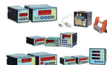
Afficheurs, compte impulsions, positionneurs programmables.