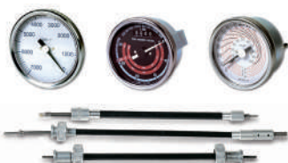
Tachymètres mécaniques et transmissions flexibles.