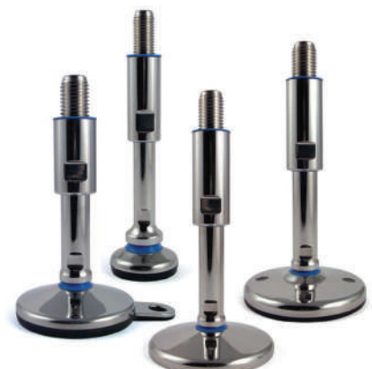
Pieds Teknohygienic certifiés 3A Ø 50 à 150 mm. Tiges filetées M12 à M36.