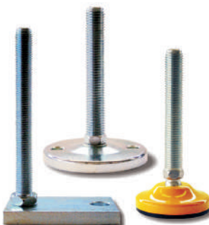
Embases acier massif Ø 40 à 159 mm. Tiges filetées M10 à M30.