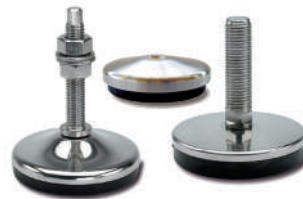
Embases antivibratoires inox. Ø 80 à 230 mm.