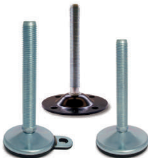
Embases tôle acier Ø 50 à 150 mm. Tiges filetées M10 à M30.