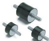
Supports plots antivibratoires