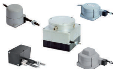
Transducteurs potentiométriques et incrémentiels à fil.