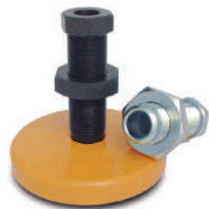
Embases et vis de réglage précision.