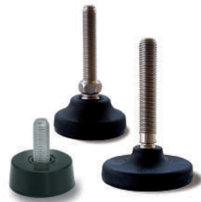
Embases plastique et caoutchouc Ø 19 à 175 mm. Tiges filetées M8 à M30.