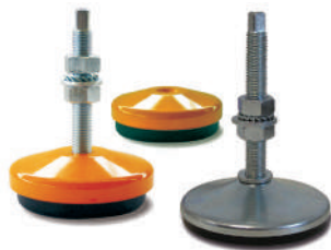
Embases antivibratoires acier. Ø 80 à 230 mm.