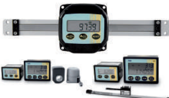
Systèmes complets autonomes de mesure linéaire, angulaire et rotative.