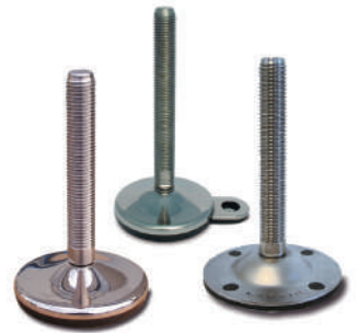
Embases tôle inox Ø 50 à 150 mm. Tiges filetées M10 à M30.