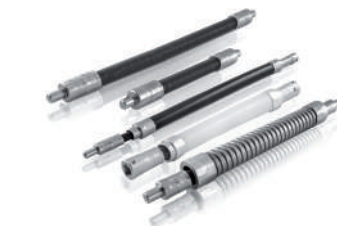
Transmissions flexibles semi-rigides et accouplements.