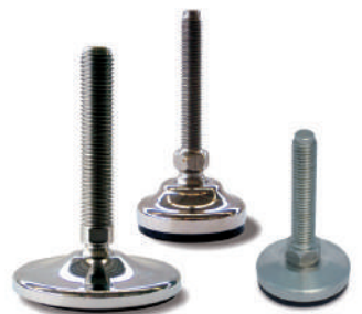
Embases inox massif Ø 30 à 160 mm. Tiges filetées M10 à M36.