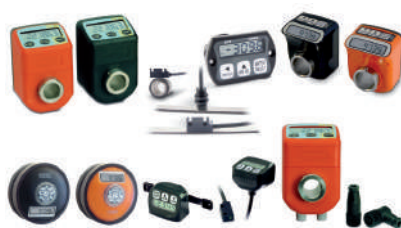
Indicateurs de position autonomes à batterie.