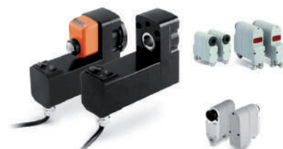
Unités de positionnement et servomoteurs.