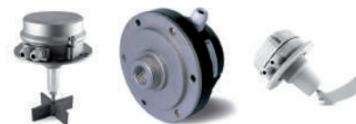
Contrôles de niveau pour solides et liquides.