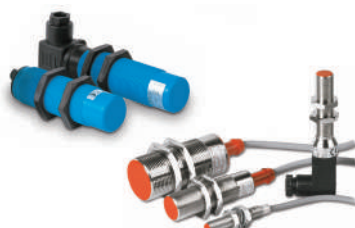
Capteurs de contrôle capacitifs et inductifs.