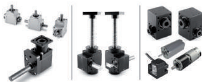
Renvois d'angle, réducteurs et vérins mécaniques.