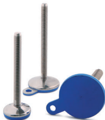
Pieds hygiéniques inox semelle EPDM bleu, Ø 50 à 120 mm. Tiges filetées M10 à M30.