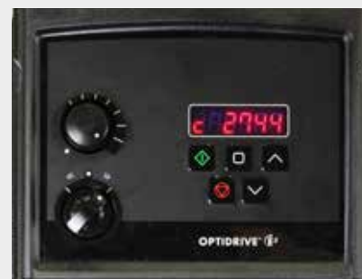
Flexibilité du débit

La modification du débit se fait simplement à l'aide du potentiomètre du convertisseur et à son affichage. En effet, chaque iDura est préprogrammée avec le débit nominal pour sa taille et indique le débit de la pompe. Il n'est donc pas utile de calculer la vitesse nécessaire pour un débit spécifique.