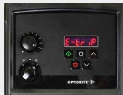
Indicateur de sécurité enclenché

Le panneau de commande de l'iDura comprend un bouton de contrôle du sens de pompage. Cette fonctionnalité permet de gagner du temps pour dégager les lignes d'alimentation obstruées, d'économiser de l'argent en récupérant arômes, essences et produits chimiques précieux ou simplement d'accélérer le changement de tuyau, bien qu'il soit peu fréquent. Toutefois, ce genre de dispositifs étant souvent utilisé de manière abusive, le bouton est verrouillable pour empêcher tout accès non autorisé.