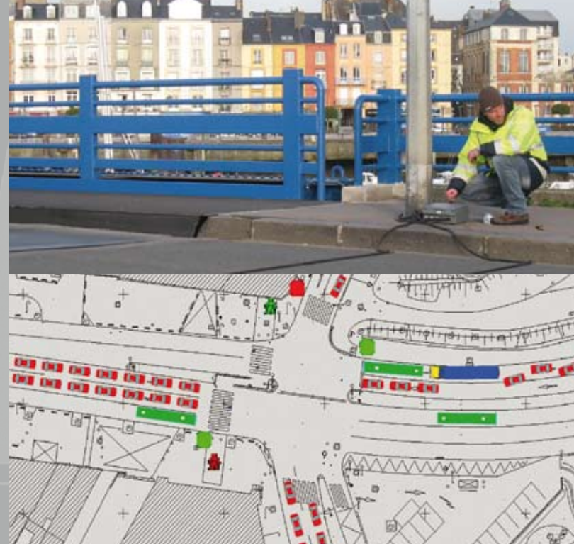
Photo du haut, Pose de compteurs Pont Ango à Dieppe Photo du bas, Modélisations dynamiques

L'expertise transversale d'IRIS conseil dans le domaine des transports individuels et collectifs lui permet de cerner les enjeux et les relations entre les différents modes de transports, pour une organisation fonctionnelle et durable de l'espace public et des territoires.