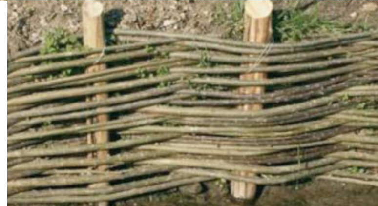
Photo du haut, Zone d'Activités Euroval à Fontenay sur Eure – Communauté de Communes du Val de l'Eure Photo du bas, Tressage en branches de saule