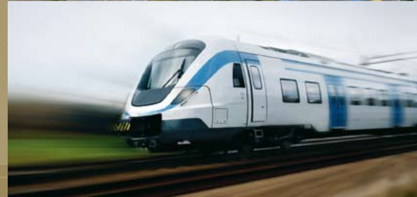
Photo du haut, Circuit des 24h du Mans, du virage Dunlop au virage du Tertre Rouge - Syndicat Mixte des 24h du Mans ».