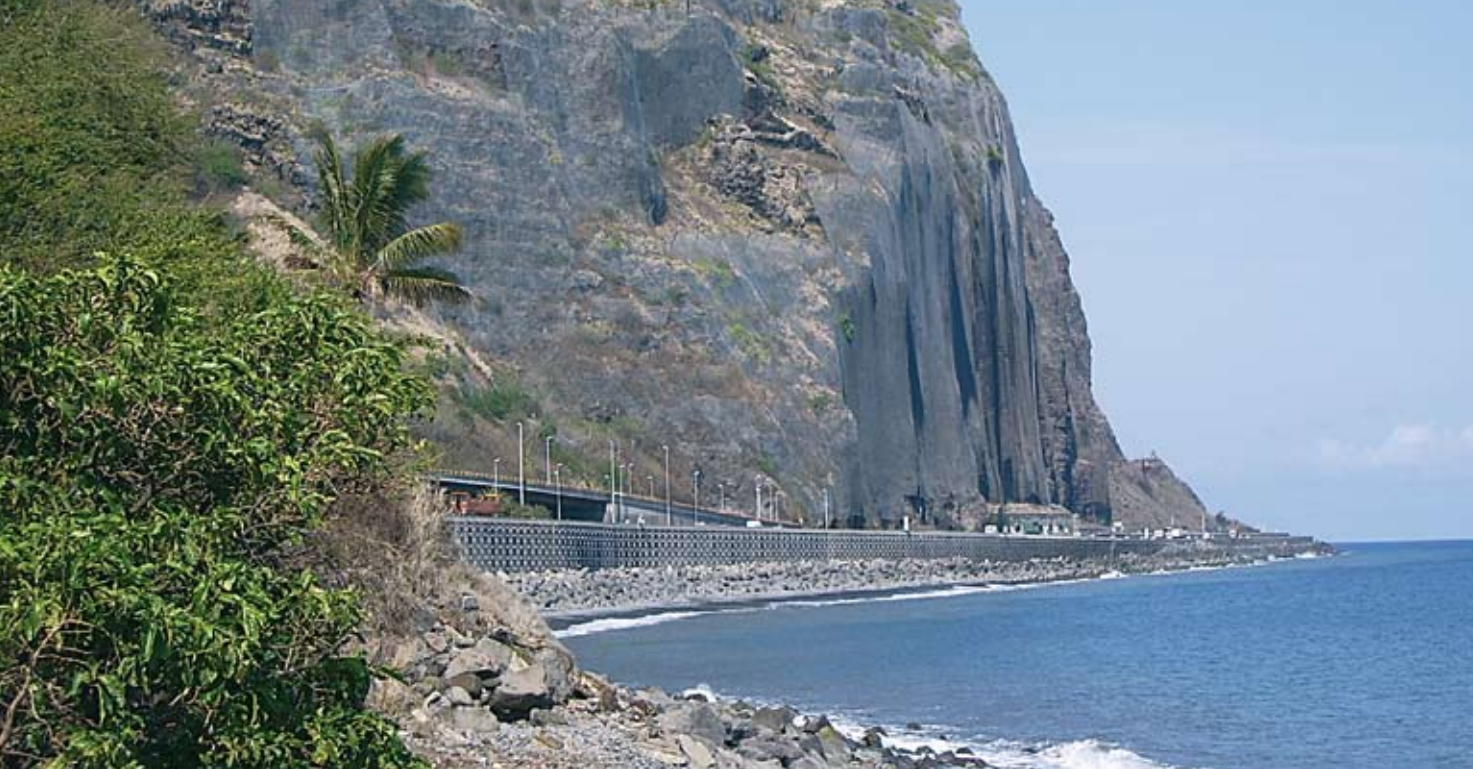
Liaison Saint-Denis-Ouest (LSDO) – Région Réunion