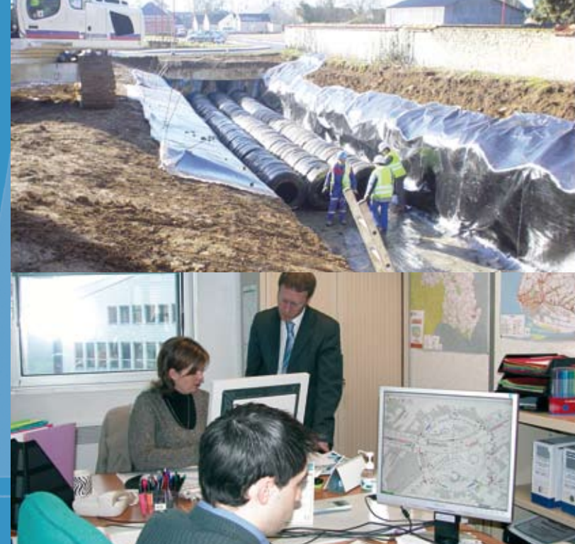
Photo du haut, Bassin de rétention à pneus Lotissement « Les Ouches » à Sours - Commune de Sours

La gestion de l'eau est devenue une préoccupation majeure des aménageurs. IRIS conseil intervient en cohérence avec le développement urbain, rural et la préservation de la ressource naturelle en eau pour proposer des solutions durables, innovantes et respectueuses des populations.