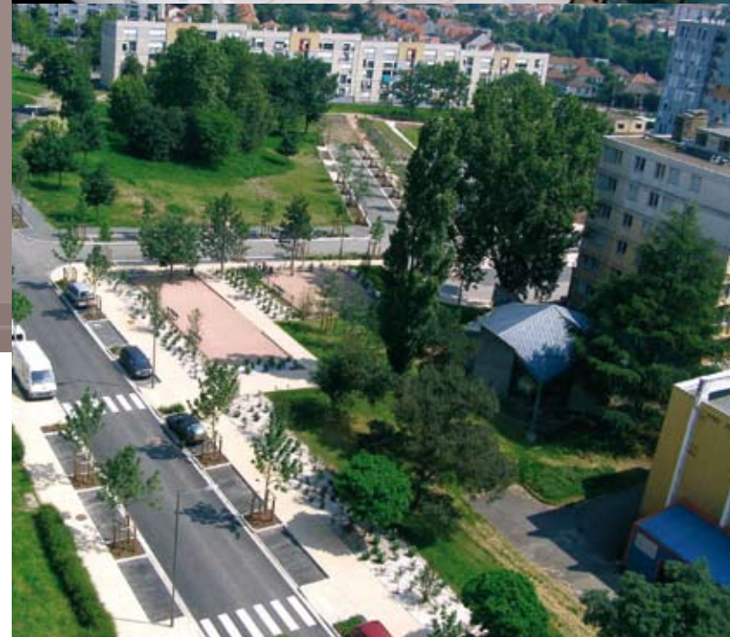
Quartier Fontbouillant à Montluçon – Communauté d'Agglomération de Montluçon