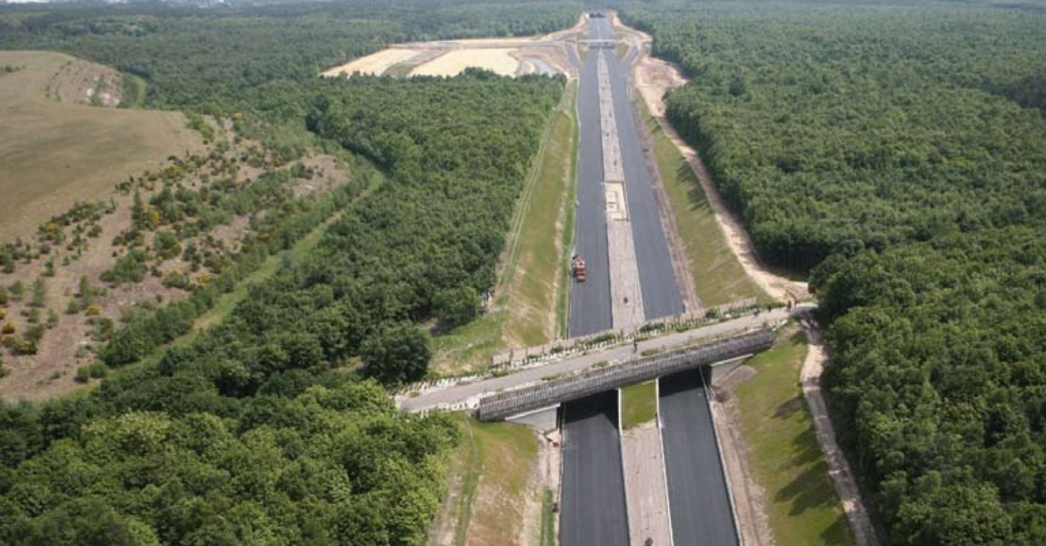
Rocade Sud de Rouen – Conseil Général de Seine-Maritime