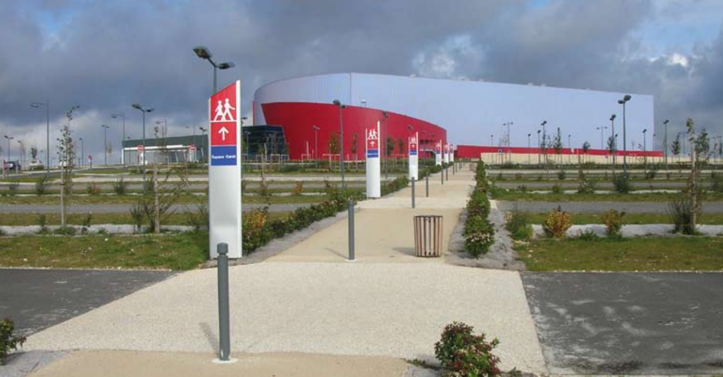
Parc des Expositions à Angoulême – Communauté d'Agglomération du Grand Angoulême