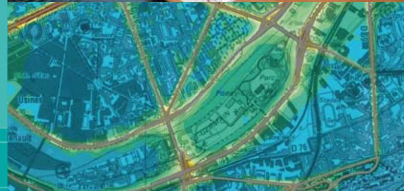
Photo du bas, Etude Air et Santé Voie Rive Gauche de Seine entre le Pont de Sèvres et le Boulevard Périphérique – Conseil Général des Hauts-de-Seine