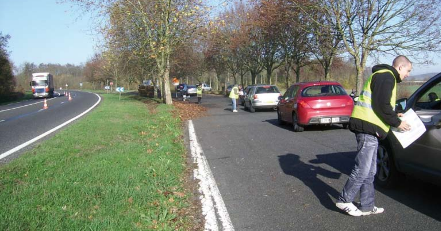
Enquêtes par interviews RD606 - Pont sur Yonne - CETE de l'Est