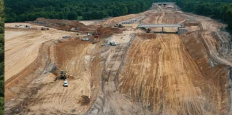
Rocade Sud de Rouen – Conseil Général de Seine-Maritime