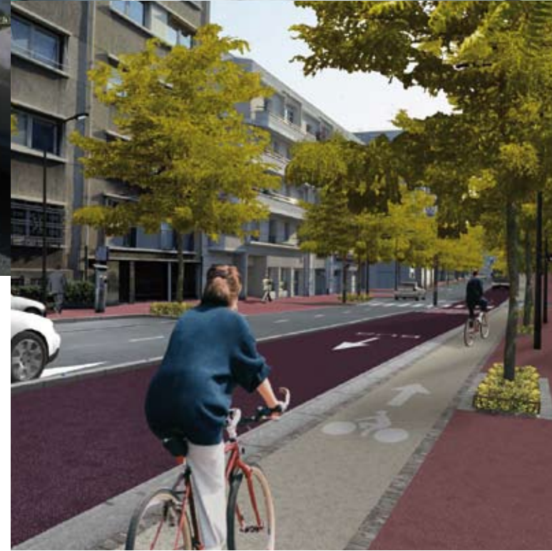
Photo du haut, Tramway de Brest - Brest Métropole Océane (Crédit : Semtram : projet de tramway de l'agglomération brestoise) Photo du bas, RD920 à Bourg-la-Reine - Conseil Général des Hauts-de-Seine