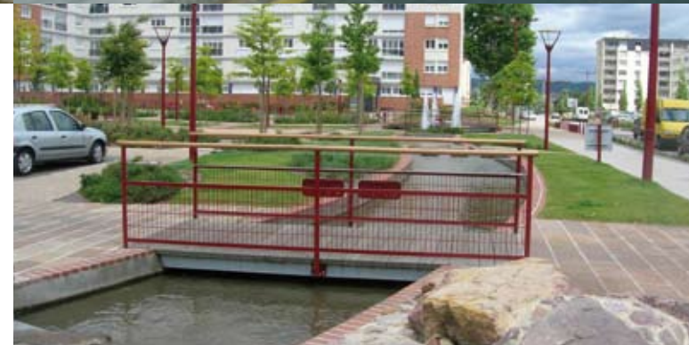
Photo du haut, Tramway des Maréchaux à Paris Photo du bas, Quartier Puchot à Elbeuf