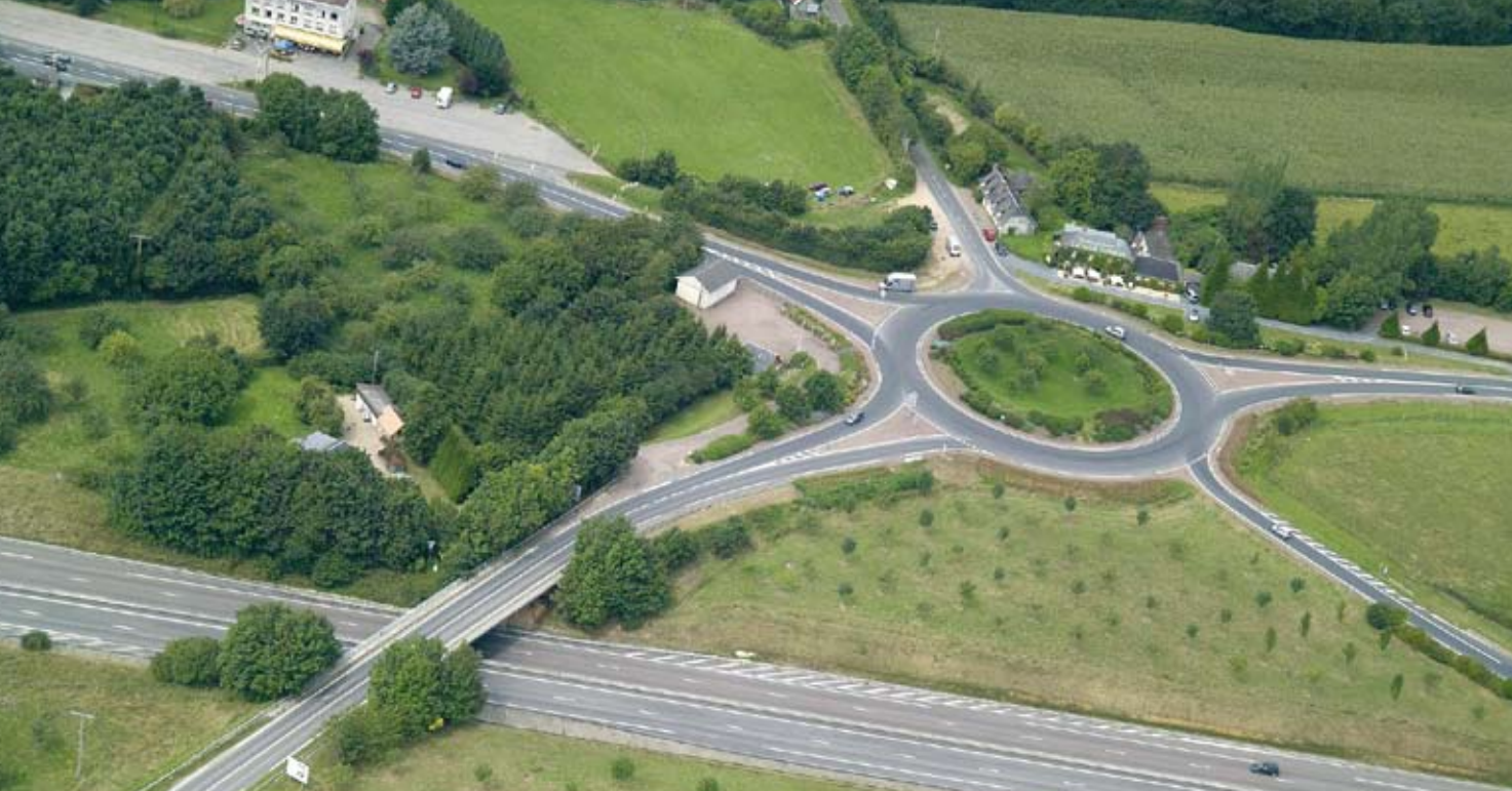
Echangeur de la Haie Tondue - SAPN