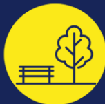
Aménagement des espaces publics