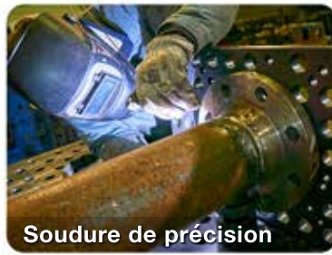
Soudure de précision