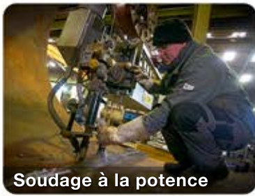
Soudage à la potence