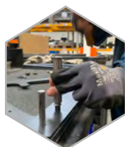
ATELIER MONTAGE ET ASSEMBLAGE