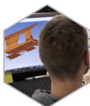
BUREAU D'ÉTUDES ET MÉTHODES