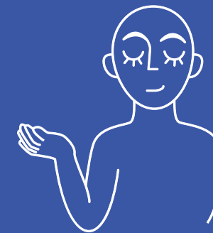
ACCUEIL DE JOUR