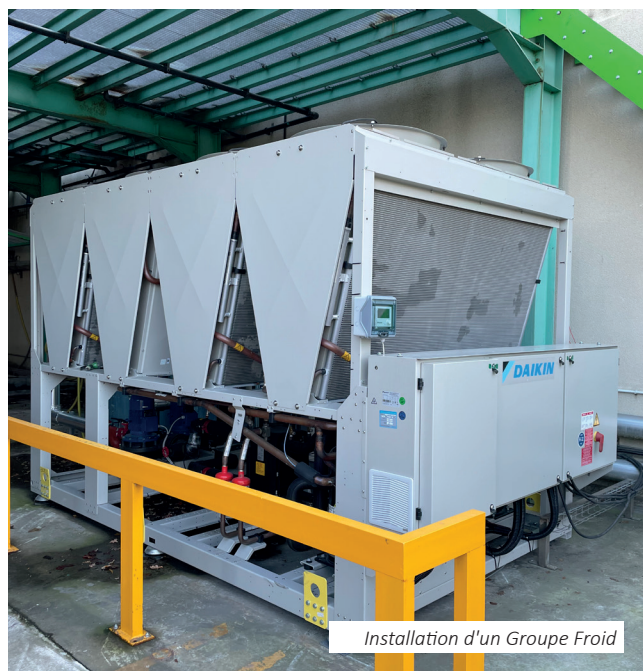
Installation d'un Groupe Froid