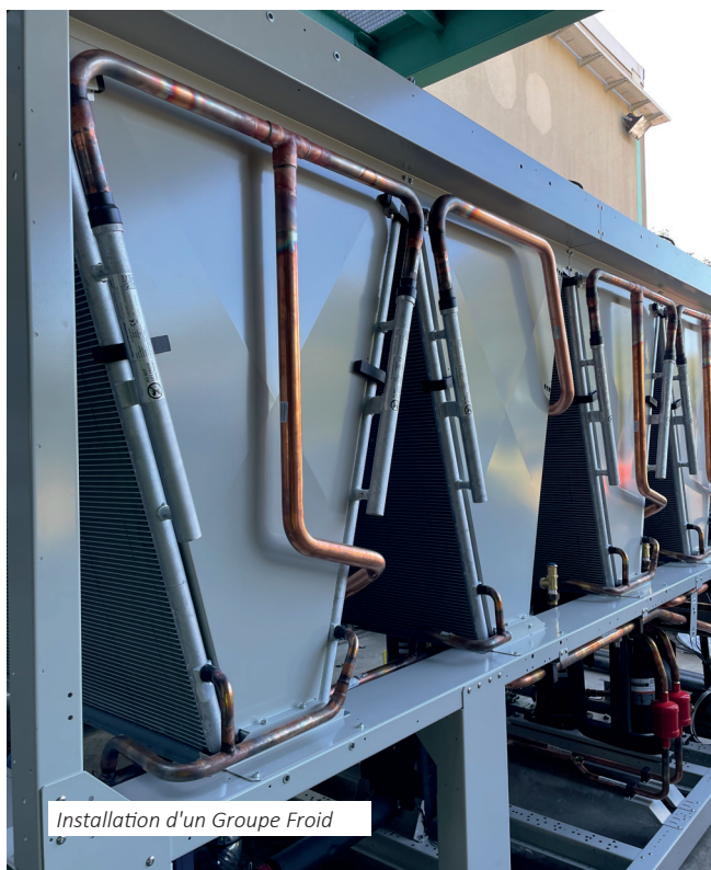
Installation d'un Groupe Froid

Quand l'équipement permet une meilleure performance énergétique, nous accompagnons nos clients dans les demandes d'aides financières (prime CEE versée par les fournisseurs d'énergie).