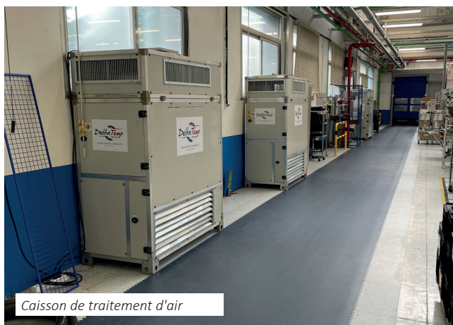
Caisson de traitement d'air