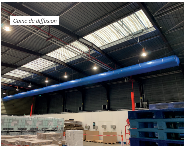
Gaine de diffusion