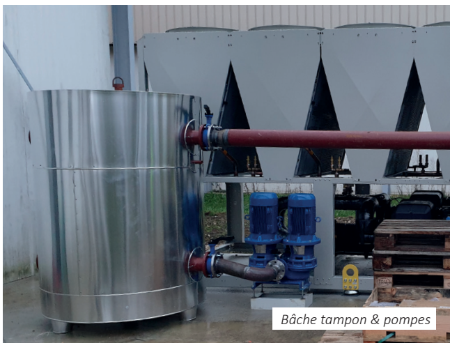
Bâche tampon & pompes