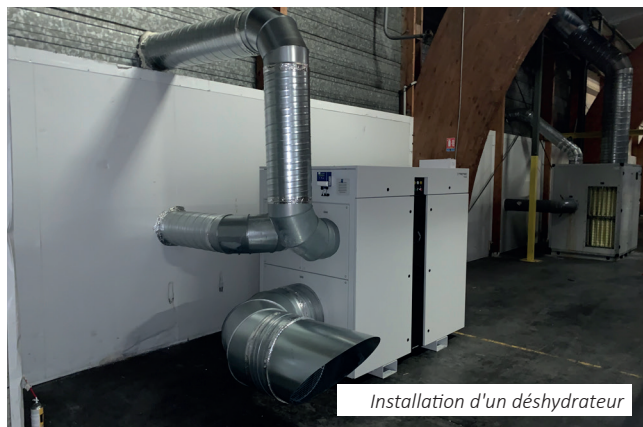
Installation d'un déshydrateur

Climatiseurs, rooftops, groupes froids, déshydrateurs, ... la mise en service est effectuée par le constructeur ou par notre personnel habilité.