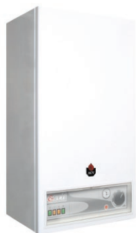
Chaudières électriques de 18 à 300 kW