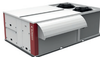
PAC Air / Air de 10 à 100 kW