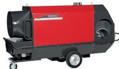
Générateurs d'air chaud industriel de 200 ou 400 kW