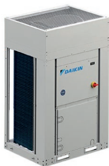
PAC Air / Eau de 16 à 135 kW