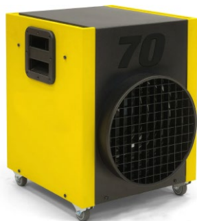
Aérothermes électriques mobiles de 3 à 18 kW