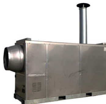
Chaufferies industrielles gaz ou fuel de 100 à 1000 kW