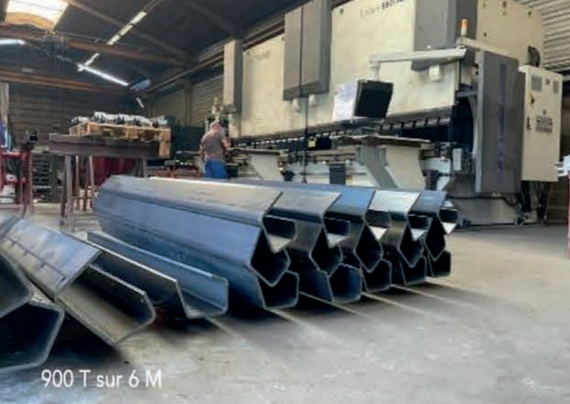
900 T sur 6 M