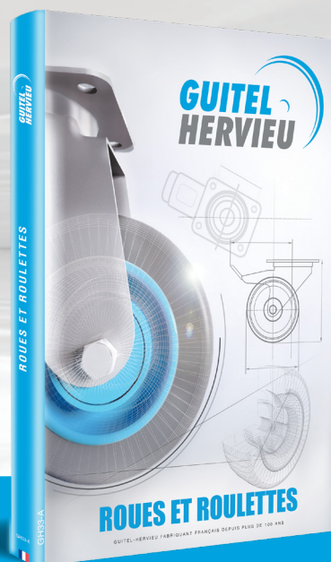
CATALOGUE ROUES ET ROULETTES